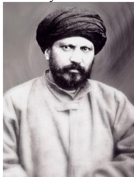
Рисунок 2. Джамаль ад-Дин аль-Афгани, мусульманский реформатор [8].

Идеология османизма всё ещё продолжала существовать, но уже ко времени младотурецкой революции 1908 г. «официальный» османизм и османизм сирийской интеллигенции окончательно разошлись, так как первый из них становился всё больше протурецким, что, конечно, не могло устроить арабское население империи [2. С. 17]. Важно заметить, что идеологии османизма придерживались также и некоторые сирийцы-христиане (например, протестант Сулейман аль-Бустани, бывший министром финансов, и католик Адиб Исхак, который в политическом плане был последователем аль-Афгани, и др.). Как отмечает современный арабист А. А. Куделин, несмотря на то, что идеи национальной борьбы и исламского джихада противоречат друг другу, так как ислам намеренно игнорирует этнические различия, история знает исламские движения (например, «Братья-мусульмане», появившееся в Египте в 1928 г.), которые акцентировали своё внимание именно на национально-освободительной борьбе против западного колониализма [3. С. 9]. Синтезом исламских и панарабских взглядов можно назвать учение сирийского философа-националиста ‘Абд ар-Рахмана аль-Кауакиби. Таким образом, время показало, что панисламизм был не в состоянии объединить народы под знаком полумесяца, поскольку эти народы разделяли разные языки, менталитет, климат, социально-политические условия и многое другое.