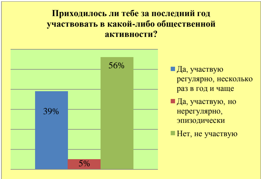
Рисунок 3. Участие студентов в общественной активности

По данному вопросу не прослеживается гендерных различий, а материальное положение незначительно дифференцирует социальную активность опрошенных: студенты, которым часто не хватает средств даже на самое необходимое, либо регулярно участвуют в социальной активности, либо совершенно в нее не вовлечены; а респонденты, относящие себя к группе тех, кому «удается более или менее нормально питаться, приобретать самую необходимую одежду», несколько чаще представителей других доходных групп эпизодически проявляют социальную активность. Жители Москвы и других городов проявляют несколько большую социальную активность, чем жители Московской области: так, доля студентов-москвичей, регулярно участвующих в социальной активности, составила 43%, жителей других городов – 38%, а Московской области – существенно меньше (23%; жители Московской области чаще отвечают, что вообще не участвуют в социальной активности – 72%).