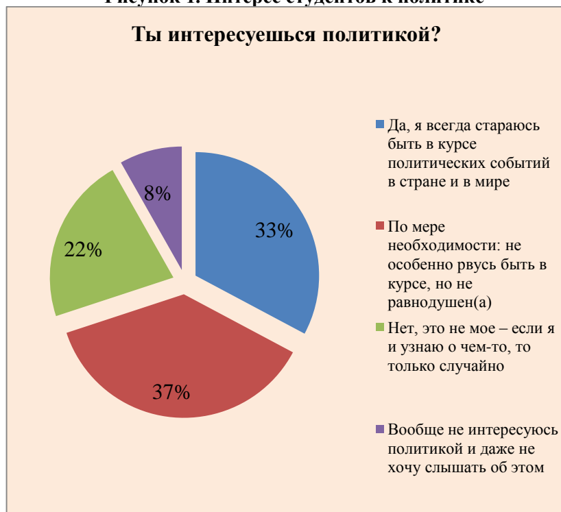
Рисунок 1. Интерес студентов к политике

Тем не менее, лишь треть опрошенных никогда не принимает участие в голосованиях, считая, что они ничего не