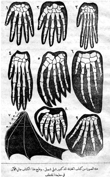
Рисунок 1. «Гомологичные органы человека и животных.»

Впервые напечатано в журнале аль-Муктаф за 1885 г., а затем воспроизведено в книге 1910 г. «Фальсафат ан-нушû уаль-иртика́» («Философия эволюции и развития») просветителя-дарвиниста Шибли Шумайля [5. С. 115].