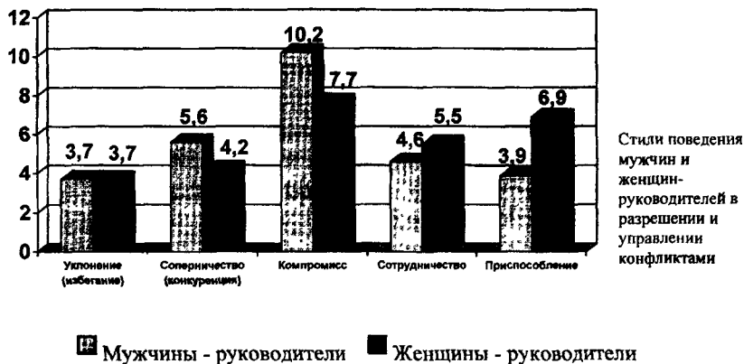
Рис. 1. Предпочтительность стилей поведения мужчин и женщин-руководителей в конфликтных ситуациях и разрешении конфликтов

Сравнивая группы мужчин и женщин-менеджеров, использующих такие стили, как соперничество, сотрудничество и приспособление, можно отметить, что большинство мужчин-руководителей устойчиво предпочитает соперничество (конкуренцию), а большинство женщин-руководителей – приспособление.