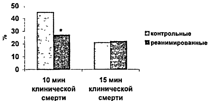
Рис. 1. Изменение общей поведенческой активности в тесте «открытое поле» у контрольных и реанимированных крыс (10-11-е сутки постреанимационного периода) после острого стрессорного воздействия в % от значений этого показателя до нанесения болевого раздражения.

ции у крыс была проведена серия экспериментов с предварительным ее угашением в 4-х последовательных сеансах теста ОП до моделирования 10-минутной клинической смерти.