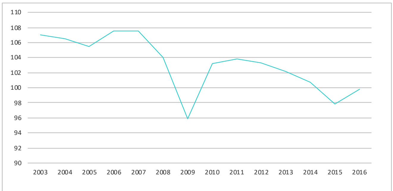
Рисунок 1. Индекс производительности труда (отношение изменения Внутреннего валового продукта к изменению совокупных затрат труда).

Согласно данным Росстата, не все было так благополучно. Так, с ростом экономики в России начался заметный спад индекса производительности труда (рисунок 1). Данный индекс производительности труда рассчитывается Росстатом как индекс изменения валового внутреннего продукта периода t к периоду (t - 1) в постоянных рыночных ценах, деленный на индекс изменения совокупных затрат труда в эквиваленте полной занятости по экономике в целом периода t к периоду (t - 1) .