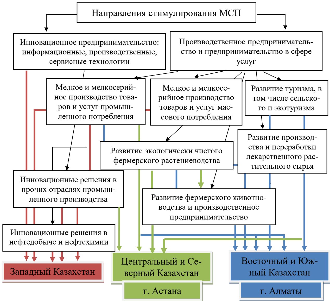
Рис. 4. Приоритетные направления стимулирования и поддержки субъектов МСП 11

Такое сотрудничество дает возможность осуществлять проекты в сфере ИКТ даже наиболее масштабного характера как для того или иного субъекта КБ, так и в рамках государственного заказа. Данное направление предусматривает государственную поддержку в виде основания специализированных ИКТ-технопарков. Сегодня для экономики актуальны цифровизация и создание инновационной экосистемы. В числе приоритетных направлений – переход к «цифровому государству» и всестороннее развитие человеческого капитала страны.