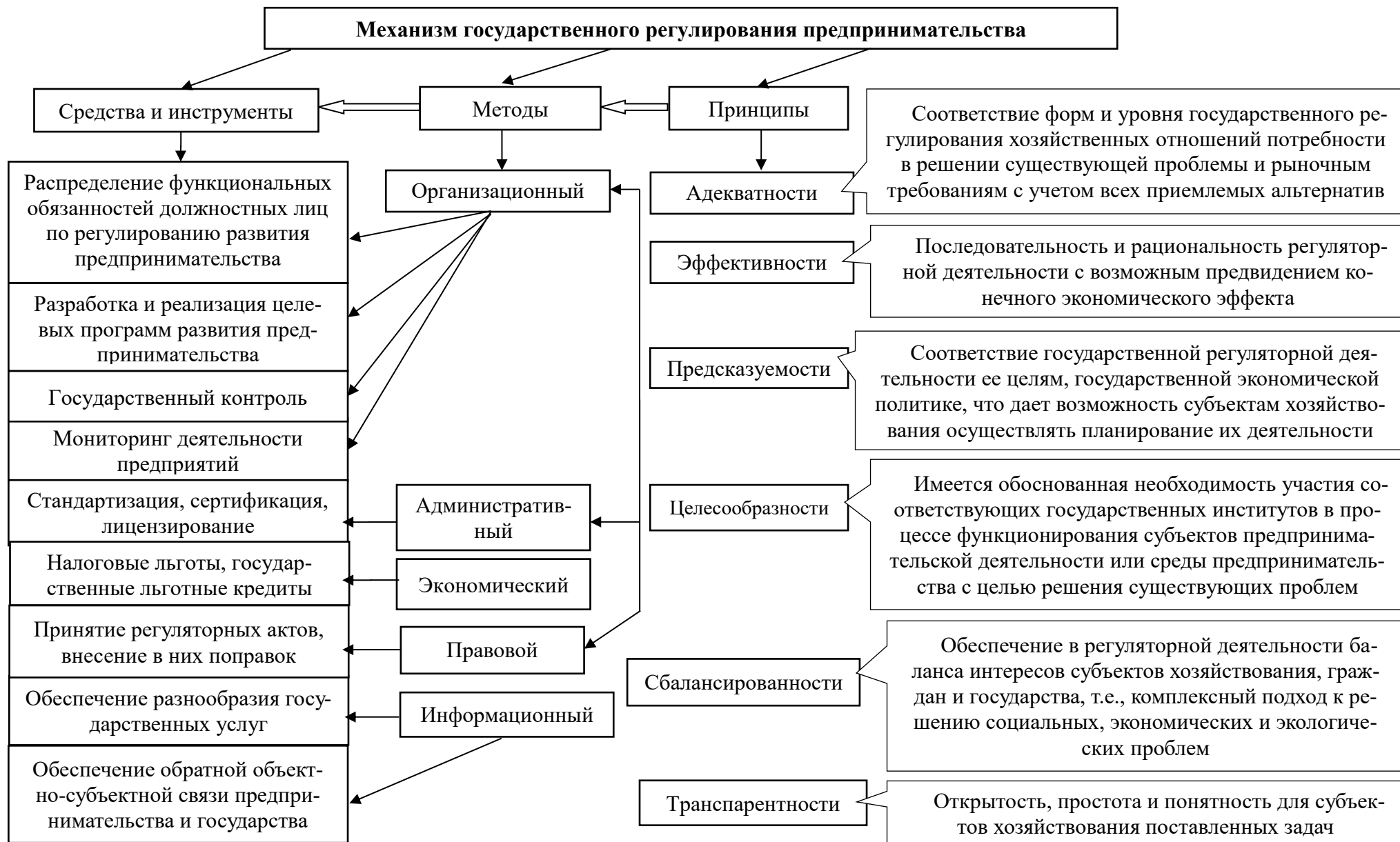
Рис. 2. Механизм государственного регулирования предпринимательства 8