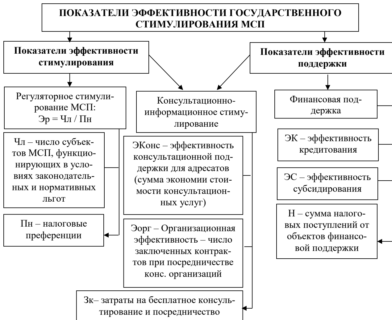
Рис. 5. Система показателей оценки эффективности государственного стимулирования МСП 12

Данное направление предусматривает государственную поддержку в виде основания специализированных ИКТ-технопарков. Сегодня для экономики актуальны цифровизация и создание инновационной экосистемы. В числе направлений – переход на «цифровое государство» и всестороннее развитие человеческого капитала страны. Поэтому здесь необходима поддержка, в том числе грантовая.