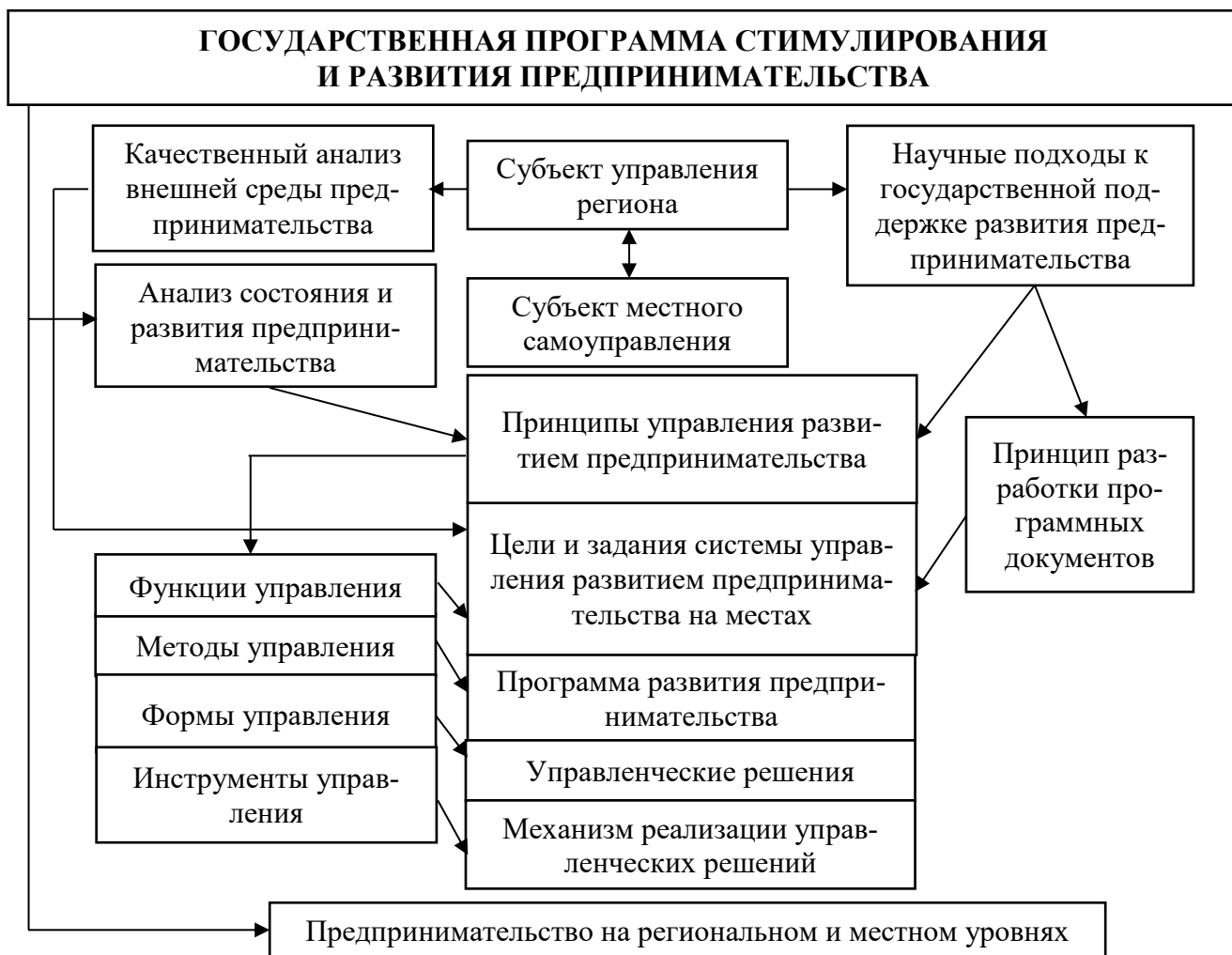
Рис. 3. Механизм разработки мер государственного стимулирования МСП на региональном и муниципальном (местном) уровнях 9

Разработка и реализация целевых программ развития предпринимательства – комплексный и системный инструмент, определяющий государственные приоритеты, а в соответствии с ними – и направления, а также опции всех видов воздействия государства на предпринимательскую среду и субъекты предпринимательской деятельности: регулирование, стимулирование и поддержку (рис. 3).