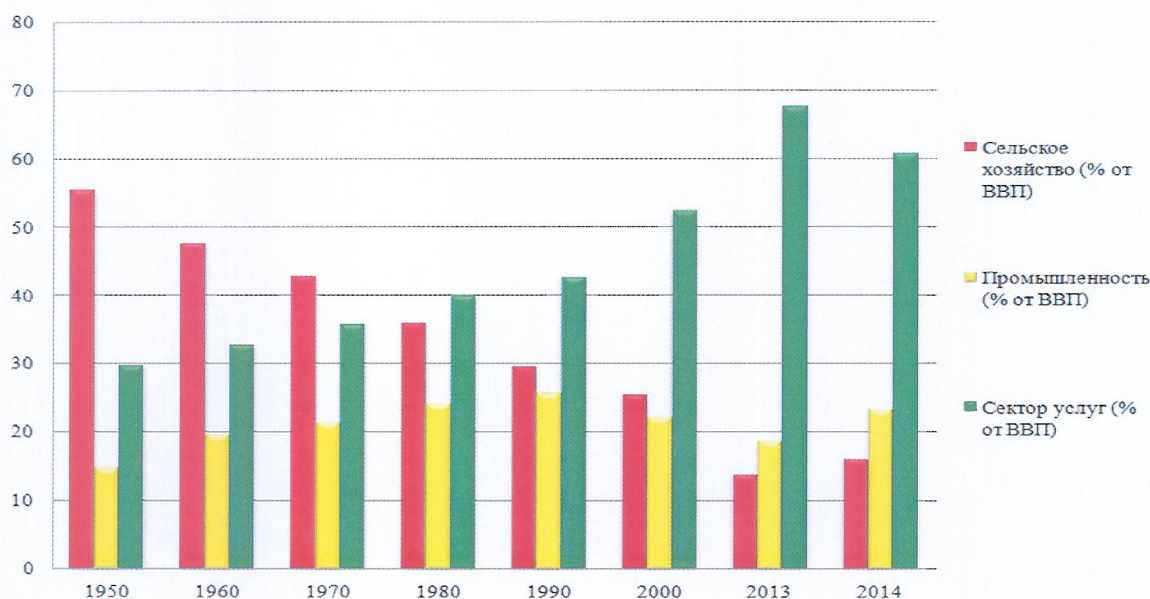
Рисунок 1. Доля секторов экономики в формировании ВВП Индии с 1950 по 2014 годы (%)

только достигнуть уровня ведущих стран Запада, но и превзойти их 1 . По данным Резервного банка Индии (РБИ) в 2014-2015 ф.г. ВВП страны формируется на 23,3% в промышленности, на 16,1% в сельском хозяйстве и на 60,6% в сфере услуг 2 .