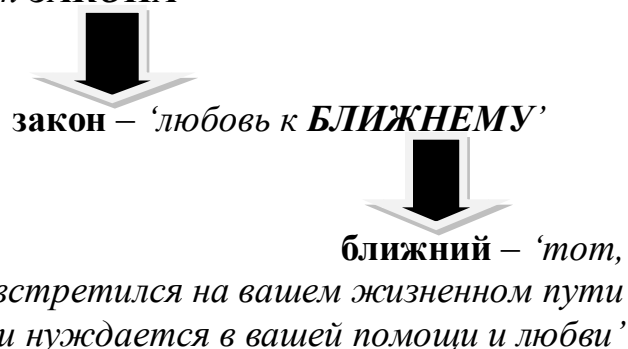
Схема 1. Семантизация сущностно значимых понятий

судья – ‘тот, кто знает, но не исполняет ЗАКОНА ’