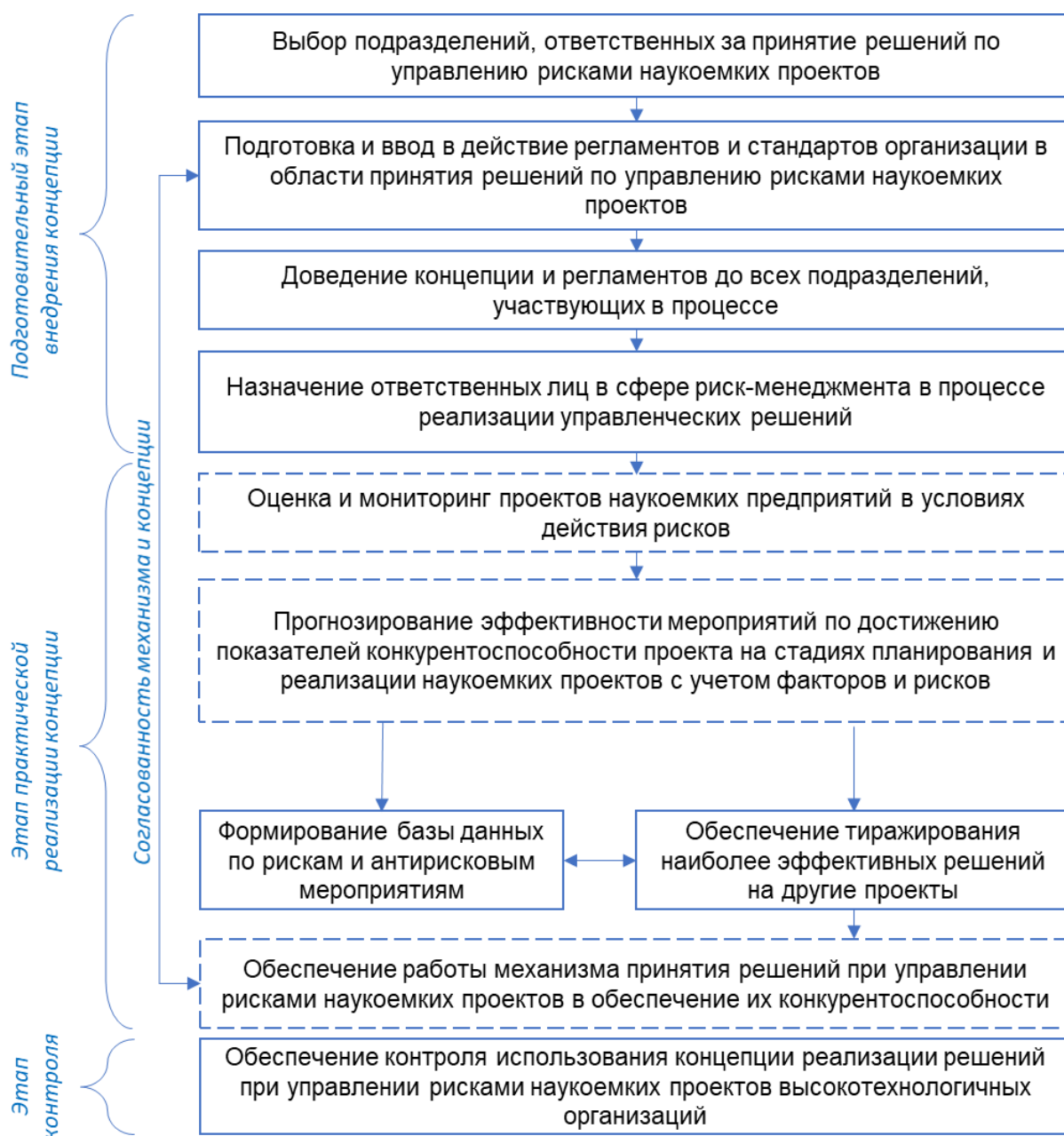
Рис. 3. Алгоритм внедрения и практической реализации концепции