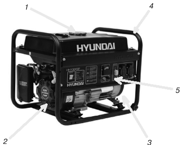
Рис. 1. Общий вид бензогенератора: 1 — топливный бак; 2 — двигатель внутреннего сгорания; 3 — генератор; 4 — рама; 5 — панель управления