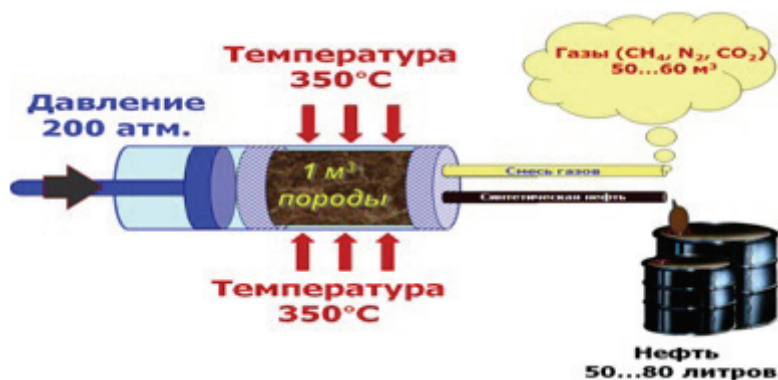
Рис. 4. Зависимость выхода нефти из породы от температуры и давления

На рис. 4 схематично показан опыт, где из 1 м 3 породы было дополнительно извлечено 50—80 л нефти и 50—60 м 3 газа при давлении в 200 атм и температуре 350 °С.