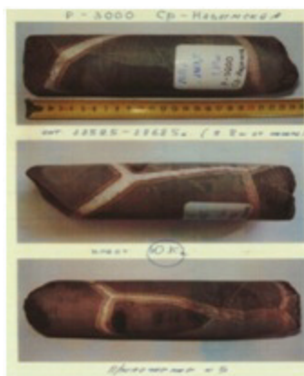
Рис. 2. Образцы керна пород Средне-Назымского месторождения

Отложения Баженовской свиты представлены тонкослоистыми, иногда тонкокомковатыми и пятнистыми углеродсодержащими глинисто-кремнистыми и известково-глинистыми отложениями. На рис. 2 представлены образцы керна пород Средне-Назымского месторождения.