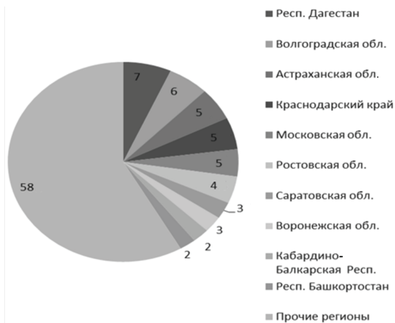
Рис. 2. Доля производства овощей в десяти субъектах-лидерах в 2011 г. (% от валового объема сбора овощей в РФ)

На долю 10 регионов — лидеров по валовому сбору овощей в хозяйствах всех категорий в 2011 г. приходилось 42% от общего объема собранных овощей в России, что в количественном выражении составило 6,13 млн т (рис. 2). Большую часть овощей собрали в субъектах Северо-Кавказского и Южного федеральных округов, субъекты центральной части России (Приволжского и Центрального ФО) также демонстрировали высокие показатели по сбору овощей.