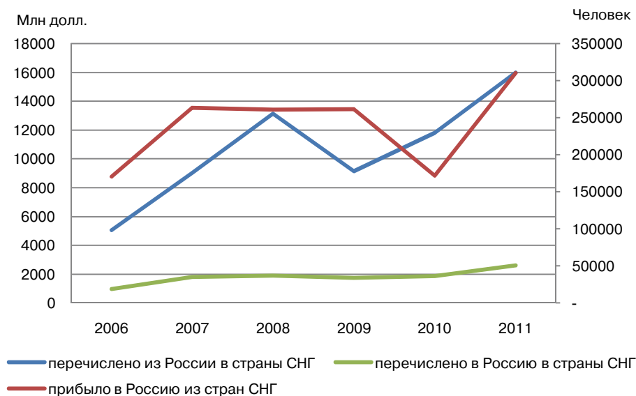
Рис. 2. Трансграничные переводы между РФ и странами СНГ, прибытие мигрантов из стран СНГ в РФ

Рис. 2 наглядно демонстрирует взаимосвязь трансграничных денежных переводов и притока мигрантов в Российскую Федерацию из стран СНГ.