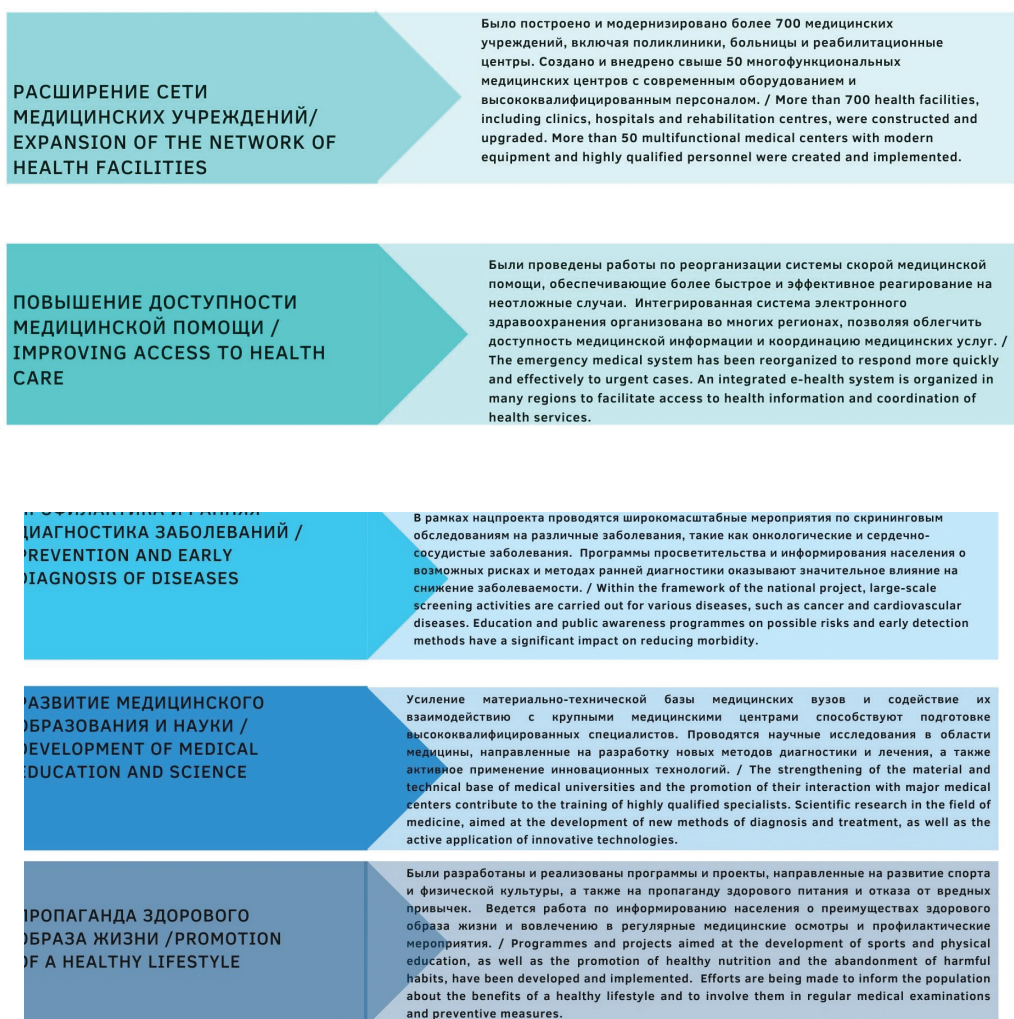
Рис. 2. Реализация национального проекта «Здравоохранение»

Кроме того, в рамках нацпроекта осуществляются широкомасштабные мероприятия, направленные на повышение уровня здоровья населения. Ведется работа по пропаганде здорового образа жизни, развитию спорта и физической культуры. Это помогает снизить распространение хронических заболеваний и формировать привычки, способствующие поддержанию здоровья (рис. 2).