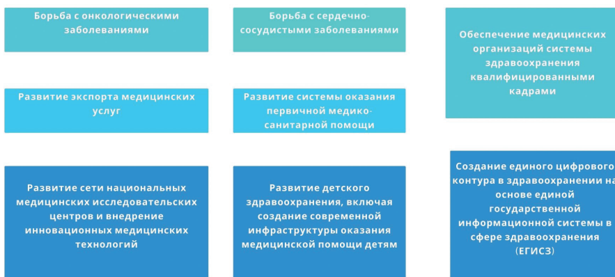
Рис. 1. Федеральные проекты в структуре нацпроекта

Национальный проект «Здравоохранение» предусматривает снижение показателей смертности населения трудоспособного возраста (до 350 случаев на 100 тыс. населения), смертности от болезней системы кровообращения (до 450 случаев на 100 тыс. населения), смертности от новообразований, в том числе от злокачественных (до 185 случаев на 100 тыс. населения), младенческой смертности (до 4,5 случая на 1 тыс. родившихся детей) и включает в себя несколько федеральных проектов (рис. 1).