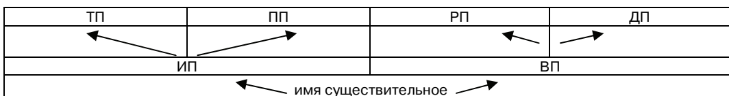
Рис. 6. Становление падежной системы по В.И. Бельтюкову [4. С. 145]

В.И. Бельтюков рассматривает проблему иерархии падежей с точки зрения онтогенеза как последовательность усвоения ребенком падежных форм родного языка.