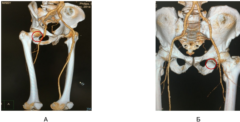
Рис. 1. МСКТ-ангиография аорто-бедренного сегмента:

артерии (ОБА) и использовали интродьюсер диаметром 6 или 7 френч. В случаях, если устьевой сегмент ПБА не визуализировался, как показано на рис. 1Б, операцию выполняли через контралатеральный ретроградный доступ в общей бедренной артерии и использовали интродьюсер диаметром 8 френч.