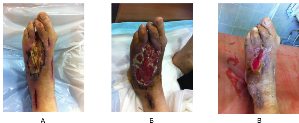
Рис. 3. Результаты лечения больного с критической ишемией левой нижней конечности после хирургического и рентгенэндоваскулярного этапов лечения: А — 2-е сутки; Б — через 3 месяца; В — через 7 месяцев

У пациентов с язвенно-некротическими поражениями стоп отмечали заживление послеоперационных ран, что позволяло их выписывать на амбулаторное до-лечение в течение 5—7 суток. На рисунках 3А, 3Б и 3В представлены результаты лечения больного с критической ишемией левой нижней конечности после успешно выполненных хирургической и рентгенэндоваскулярной операции и эффективного амбулаторного лечения.