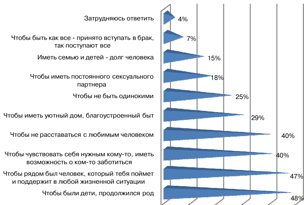
Рис. 7. Распределение ответов на вопрос «Для чего, по-Вашему, люди вступают в брак, создают семью?»

Учитывая, что сегодня заключение брака предполагает дорогостоящую «процедуру» (свадьбу, свадебное путешествие) и «последствия» (нередко съём жилья, обеспечение бóльшего количества членов семьи всем необходимым и пр.), вполне предсказуемо в качестве оптимального возраста вступления в брак 42% студентов назвали 24—25 лет, два других наиболее частотных интервала сосредоточены вокруг этого показателя: 21—23 года (27%) или же 26—35 лет (25%). Интервалы не оговаривались в анкете: респондентам был задан открытый вопрос «Какой возраст Вы считаете оптимальным для официального вступления в брак?», полученные ответы были сгруппированы в интервалы исходя из их наполненности. Группировка выявила и гендерные различия: 46% девушек считают оптимальным возрастом вступления в брак 24—25 лет, юноши считают таковым два интервала — 24—25 лет (37%) и 26—35 лет (40%); верхний предел брачности в обеих подгруппах одинаков — 26—35 лет.