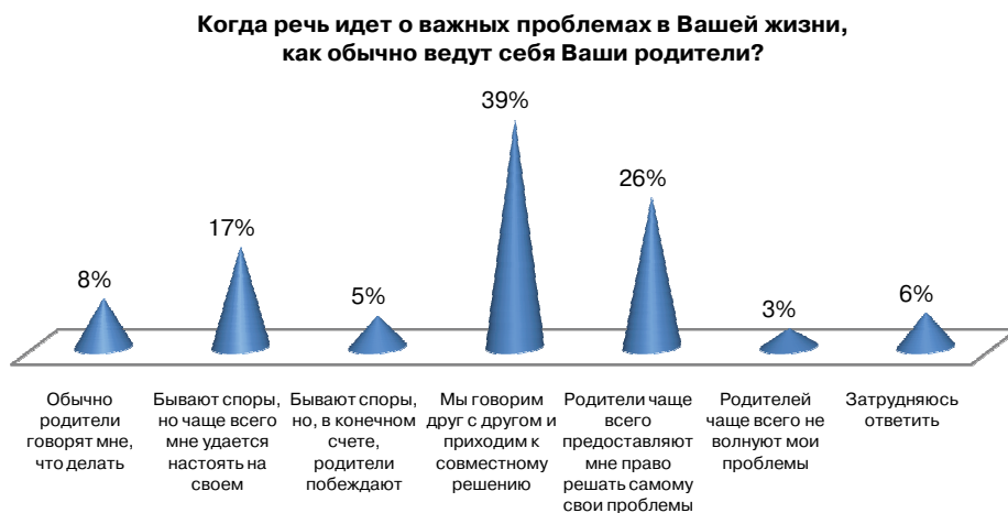
Рис. 2. Распределение ответов на вопрос «Когда речь идет (или заходила прежде) о важных проблемах в Вашей жизни, требующих серьезных решений, как обычно ведут/вели себя Ваши родители?»

Когда речь заходит о принципиально важных решениях в жизни студентов, то в их взаимоотношениях с родителями срабатывает одна из трех стратегий: достижение компромисса, принятие совместного решения (в 39% случаев); родители продавливают собственный вариант (13%); родители соглашаются с выбором ребенка (43%). Иными словами, в большинстве семей превалирует уважительное отношение к мнению ребенка, стремление прислушиваться к нему (рис. 2).