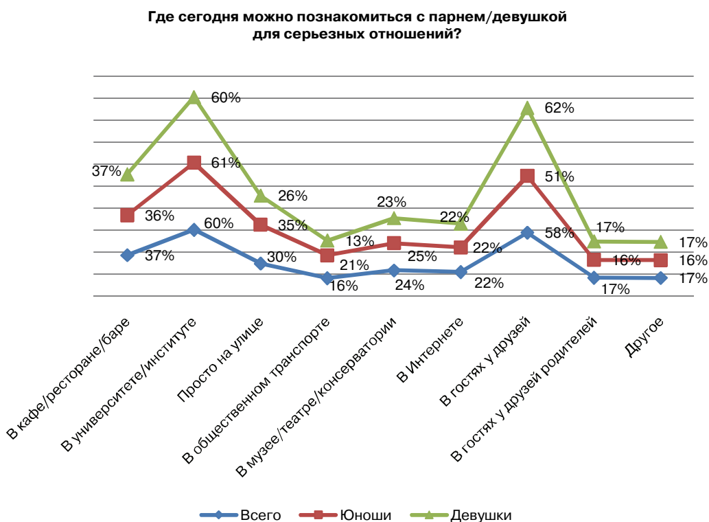
Рис. 5. Распределение ответов на вопрос «Как Вы считаете, где сегодня можно познакомиться с парнем/девушкой в Москве для серьезных отношений?»

значности уверен лишь каждый третий, и гендерных различий, как можно было бы ожидать, здесь не прослеживается. Видимо, в восприятии молодежи семья и брак могут быть основаны не только на любви, а она, в свою очередь, необязательно предполагает создание семьи и заключение брака: об этом свидетельствует рост числа так называемых «гражданских браков» — официально не зарегистрированных, но рассматриваемых совместно проживающими людьми как полноценный аналог брака, просто без «никому не нужных формальностей/бумажек».