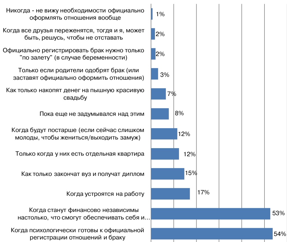
Рис. 6. Распределение ответов на вопрос «Как Вы считаете, когда людям следует официально оформлять свои отношения?»

Студенты считают, что люди вступают в брак ради продолжения рода (48%), обретения близкого человека, который поймет и поддержит в любой жизненной ситуации (47%), чтобы не расставаться с любимым, чувствовать себя нужным кому-то, иметь возможность о ком-то заботиться (по 40%). Значительно отстают от этих мотивов создания семьи и вступления в брак стремление к уютному быту (29%), желание избежать одиночества (25%), обрести постоянного сексуального партнера (18%) и выполнить свой человеческий долг (15%) (рис. 7). Гендерные