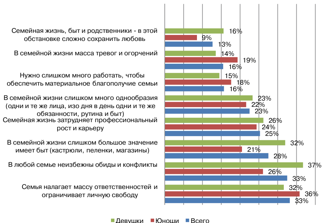
Рис. 8. Распределение ответов на вопрос «В чем Вы видите отрицательные стороны семейной жизни?»

Самыми распространенными причинами семейных конфликтов респонденты считают расхождения во взглядах на быт и образ жизни семьи (57%), отсутствие/недостаток денег (44%), сексуальную неудовлетворенность (36%), нежелание выполнять домашние обязанности (35%), чрезмерное общение одного из членов семьи со своими друзьями/родственниками (32%), его гиперувлеченность своими интересами (хобби) или же депрессию (по 27%) — все эти причины сфокусированы в частной сфере (религиозные и идеологические противоречия в совокупности набрали 11%).