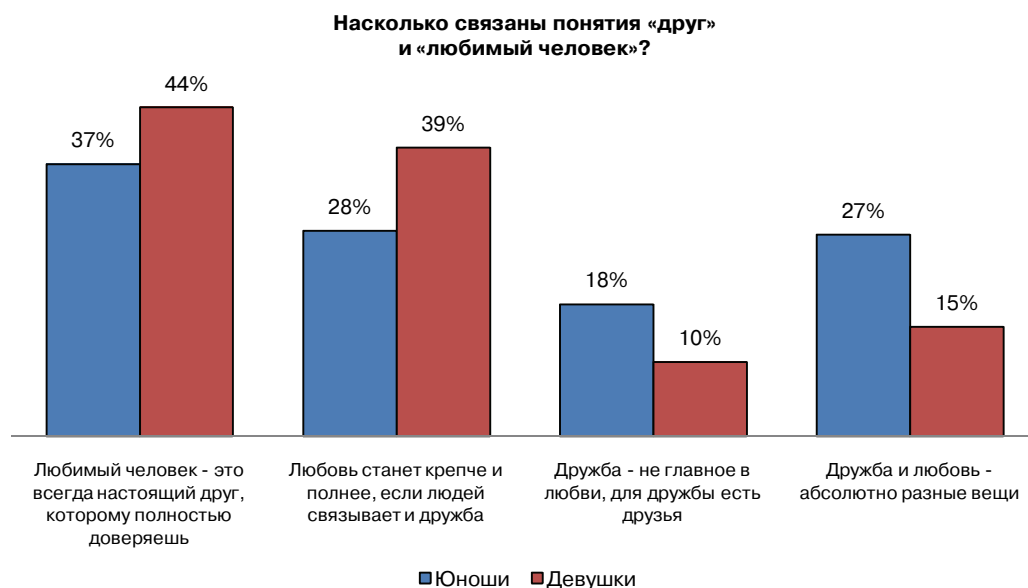
Рис. 4. Распределение по полу ответов на вопрос «Насколько, по Вашему мнению, связаны понятия «друг» и «любимый человек»?»