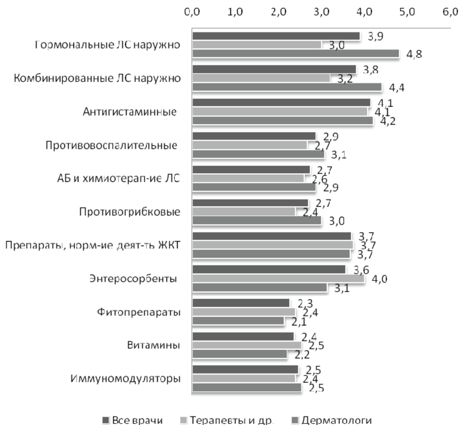
Рис. 1. Частота назначения врачами различных групп лекарственных препаратов для лечения хронических кожных заболеваний

мины, иммуномодуляторы и иммуностимуляторы, фитопрепараты. У людей с хроническими дерматозами не редки нарушения в желудочно-кишечном тракте, поэтому врачи часто назначают препараты, нормализующие деятельность пищеварительной системы, корректирующие нормофлору и энтеросорбенты (рис. 1). Частота назначения оценивалась по 5-бальной шкале, где 1 — никогда, 2 — редко, 3 — периодически, 4 — часто и 5 — постоянно.