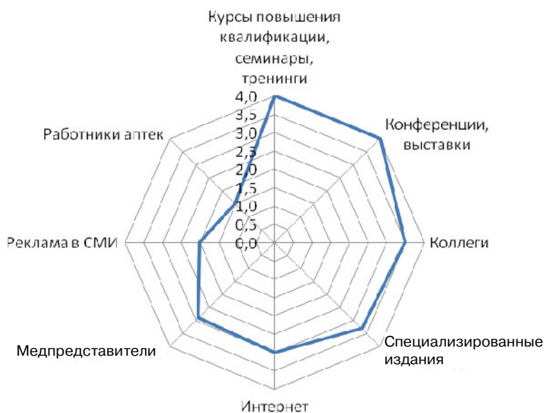
Рис. 2. Наиболее популярные каналы коммуникации для получения новых сведений о ЛС

Наиболее популярным каналом коммуникации для получения новых сведений о лекарственных средствах являются конференции, выставки, курсы повышения квалификации, информация от коллег и специализированных изданий, а также сеть Интернет (рис. 2).