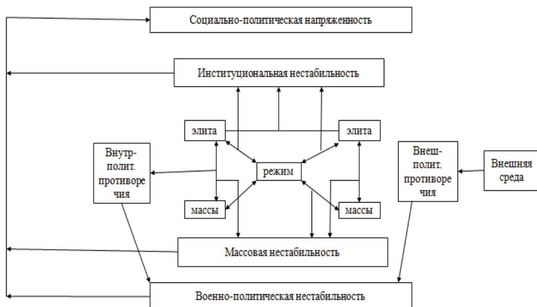
Рис. 2. Оценка социально-политической напряженности в Пакистане.

Для оценки индикаторов социально-политической нестабильности в странах Большого Ближнего Востока применялась методика Центра международных исследований МГИМО по оценке напряженности в Пакистане (рис. 2).