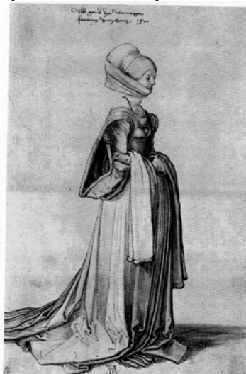
Рис. 4 А. Дюрер «Танцевальное платье нюрнбергской горожанки», ок. 1500. Рисунок, акварель. Альбертина, Вена.

тонкую ткань, выбивающуюся из-под плотного и богато украшенного рукава, тесьма, украшающая лиф изображена достаточно подробно, и при желании подобный узор можно было бы воссоздать, используя данный рисунок как образец. В более поздних эскизах Дюрер несколько видоизменяет манеру фиксации наряда: рисунок становится менее графичными, для передачи цвета начинает использоваться акварель - искусство штриховки уступает место более лаконичному и живописному образу, иными словами, в такой работе, как «Танцевальное платье нюрнбергской горожанки» (ок.1500) (Рис. 4) ведущую роль играет платье само себе, оно служит созданию поэтического образа современницы Дюрера, а непосредственно сами графические приёмы становятся средствами для правдоподобной фиксации.