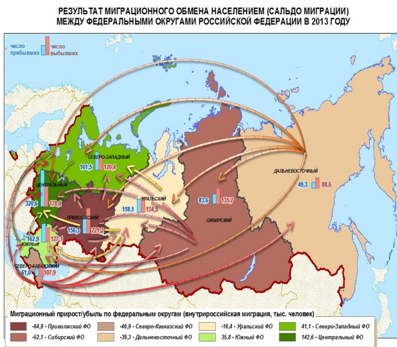
Рис. 1. Карта внутривоссийской миграции по территориям прибытия и выбытия. [12]

Одним из факторов влияния на социализацию москвичей является высокий уровень внутренней миграции. Происходит миграция из стран СНГ и других субъектов РФ в Москву и другие крупные города. Столица - не единственный регион, отличающийся миграционными потоками, однако здесь наиболее ярко выражены факторы, которые обеспечивают миграцию.