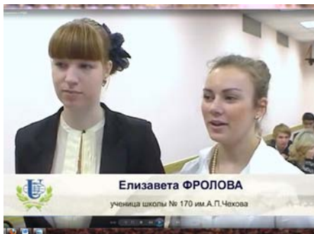
Конкурсанты делятся впечатлениями