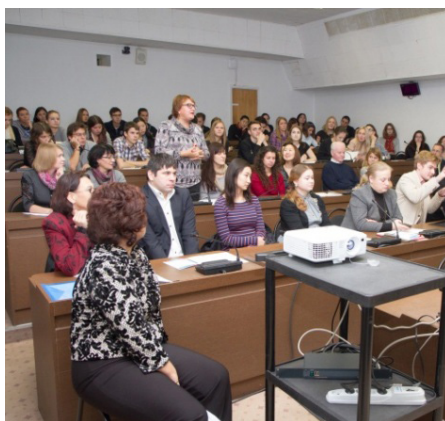
Учителей заинтересовали педагогические методики докладчика