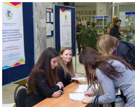
На регистрацию пришли первые участники