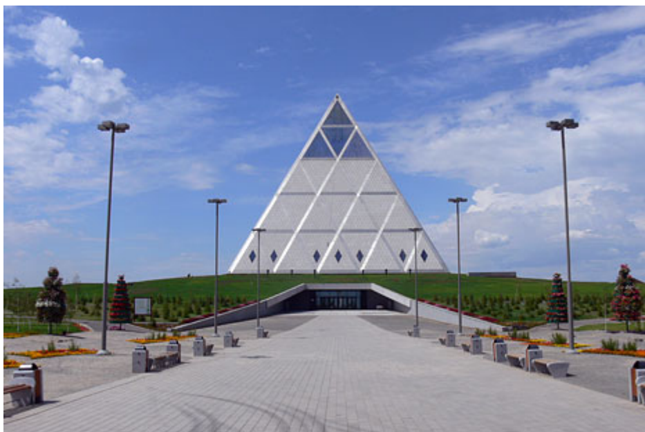
Рис.7 Пирамида Мира и Согласия

В столице Казахстана Астане дважды состоялся Съезд мировых и традиционных религий (сентябрь 2003 г. и сентябрь 2006 г.). На съезде были представлены делегации самых авторитетных представителей от более чем 20 разнообразных конфессий Востока и Запада.