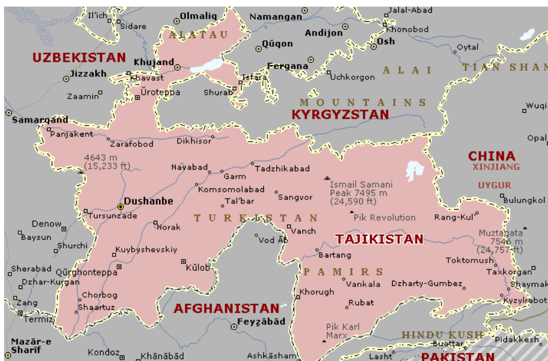
Рис.29 Карта Таджикистана

В Таджикистане был воплощен кланово-региональный сценарий борьбы за власть. В стране начинают резко проявляться этнические и субэтнические противоречия.