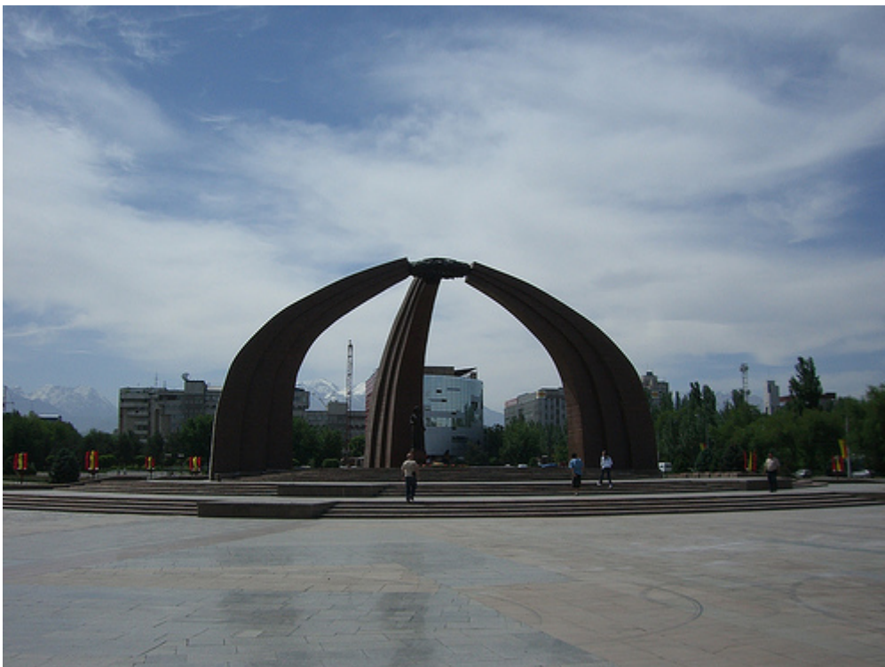
Рис.35 Площадь победы Киргизии

Борьба за политическую власть перешла в борьбу за контроль над экономическими активами. На выборах 2005 г. победу одержал К. Бакиев .