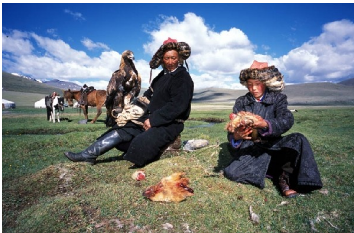
Рис.9 Жители Ферганской долины

Ферганская долина является классическим примером социальной напряженности в условиях перенаселенности, земельного голода и переизбытка трудовых ресурсов, в первую очередь в сельском хозяйстве. Эти проблемы усугубляются сложной этнической ситуацией в регионе, где, несмотря на абсолютное численное доминирование узбеков, сталкиваются интересы нескольких национальных общин (узбеков, киргизов, таджиков, а также представителей некоторых других национальностей). Все это происходит на фоне высокой активности различных подпольных исламистских групп, связанных с радикальными зарубежными исламскими организациями.