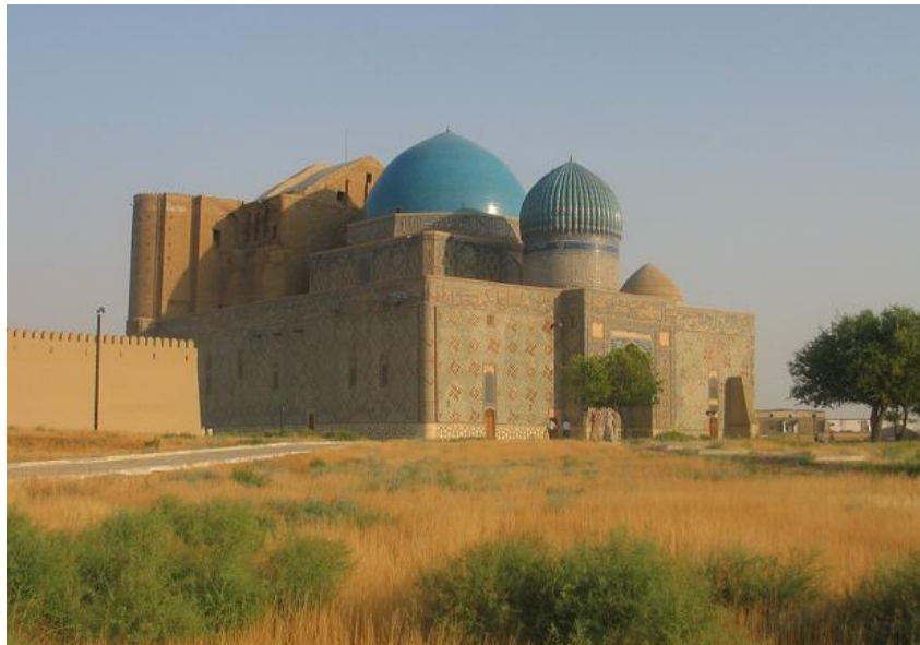
Рис.6 Мавзолей Ходжи Ахмеда Ясами в Казахстане

После распада Монгольской империи идет процесс формирования культурного облика современных народов Центральной Азии и их антропологических типов. Наиболее европеоидное население – это таджики, живущие в горах и немногочисленные горные народы, говорящие на древних восточноиранских языках.