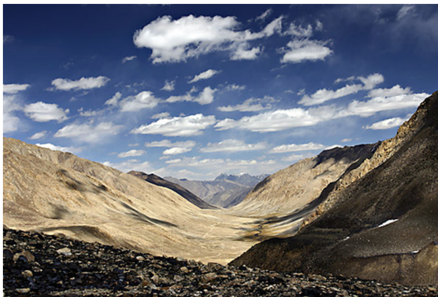
Рис.2 Горный ландшафт Таджикистана

Центральная Азия – это область «от Каспия до Большого Хингана и от границ сибирской тайги до Гималайских гор» в центре великого Евразийского материка, не имеющая стоков в океаны. Центральная Азия отличается контрастным климатом и контрастным рельефом. Значительную часть этой территории занимают пустыни Каракумы и Кызылкум. На севере и северо-востоке Центральной Азии протянулись степи.