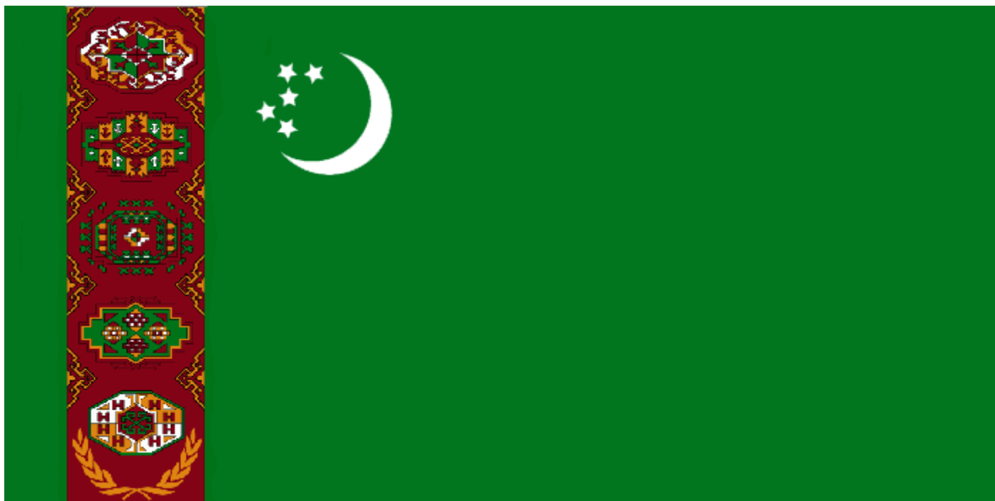
Рис.24 Флаг Туркменистана

полномочия на бессрочное президентство. С. Ниязов занимал одновременно посты премьер-министра и верховного главнокомандующего страны.