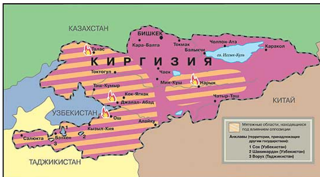
Рис.8 Карта Ферганской долины

География региона. Ферганская долина – исторический, культурный, религиозный и экономический центр Средней Азии. Ферганская долина раскинулась по тектонической впадине Тянь-Шаня в среднем течении реки Сырдарьи на высоте 300-1000 м. Она окружена горными хребтами. Общая территория Ферганской долины составляет 77,9 тыс. кв. км. Ферганская долина – уникальный уголок Средней Азии. Единственным выходом из долины являются «Бекабадские ворота», ширина которых 20 м, расположенные на территории Ходжекентской области Таджикистана. Ферганскую долину – большой цветущий оазис с самыми плодородными землями в Центральной Азии и прекрасным климатом – называют Золотой долиной.