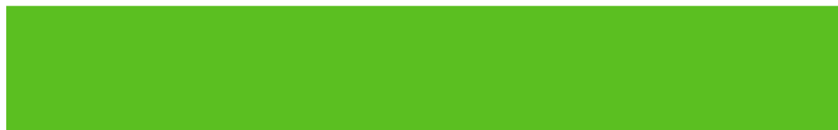
Рис.30 Флаг Таджикистана