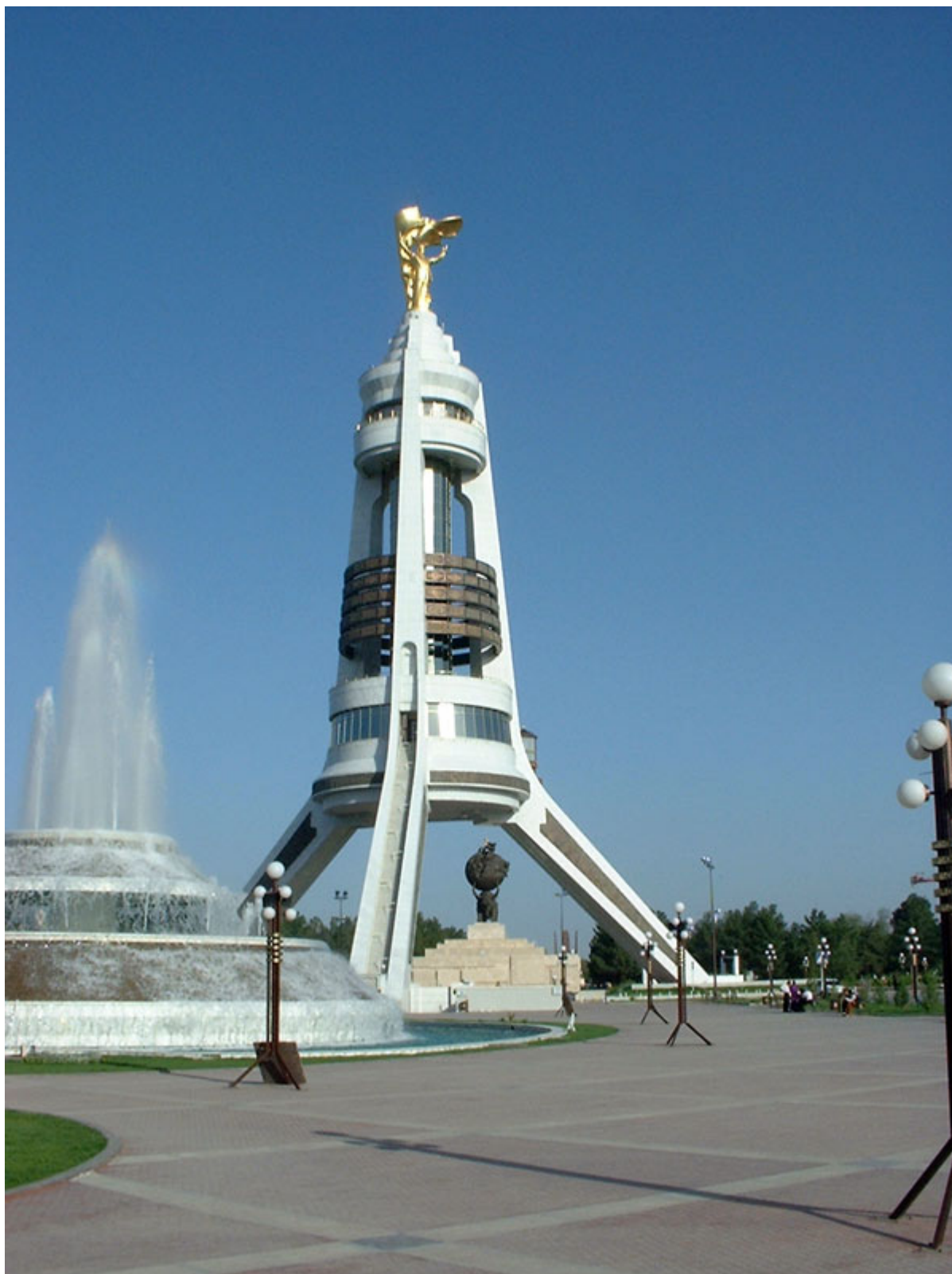
Рис.27 Башня независимости Туркменистана

В 2005 г. С. Ниязов впервые объявил о программе демократических реформ политической системы страны, включая постепенный переход к многопартийной системе.