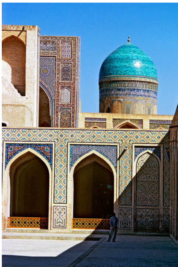
Рис.21 Архитектура Узбекистана(2)

«Акрамийа» (основана ферганцем Акрамом Юлдашевым; организовала попытку государственного переворота в мае 2005 г. в Андижане).