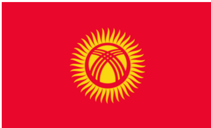
Рис.33 Киргизский флаг