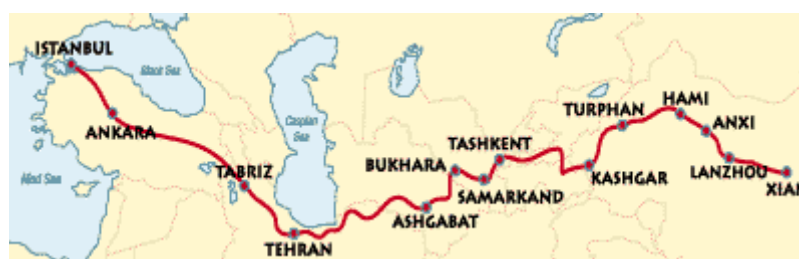
Рис.38 Великий Шелковый Путь

И Китай, и ЕС и ряд других стран мира уделяют большое внимание восстановлению Великого шелкового пути. «Маршрут этого пути в 200 г. от Р.Х. пролегал по Аппиевой дороге в Брундизий, а далее морем и сушей в Византию, через Малую Азию, Бухару, Самарканд и Фергану в Центральную Азию, а затем – через Кашгар и пустыню Такла-Макан в Сюджоу и Ксинань».