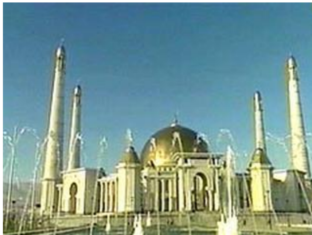
Рис.26 Архитектура столицы Туркменистана(1)

В Туркменистане удается поддерживать определенный кланово-племенной баланс, обеспечивая тем самым политическую стабильность. Современный Туркменистан контролируют в основном текинцы (крупнейшее из туркменских субэтносов-племен) во главе с Туркменбаши С. Ниязовым. В отдельных регионах достаточно сильные позиции имеют представители других племенных общностей (йомуды, эрсари) – не способные, однако, в силу своей малочисленности претендовать на господство в масштабах всей республики.