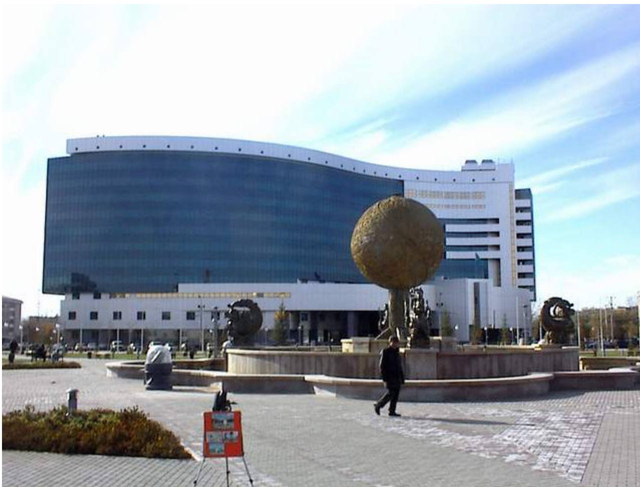
Рис.15 Министерство финансов Астаны

В Казахстане существует довольно значительный дисбаланс: до 85% госаппарата и членов Верховного совета Казахстана являются выходцами из Старшего (Южный и Юго-Восточный Казахстан) жуза. В подавляющем большинстве окружение президента принадлежит к старшему жузу, тогда как практически вся оппозиция является выходцами из Младшего (Западный Казахстан) и Среднего (Северный, Центральный и Восточный Казахстан) жуза. Политическая система характеризуется патронально-клиентальными отношениями: становление Казахстана усиливает противоречия между жузами (кланами), но они не являются решающими. Более важными стали различия между регионами, показатели ВВП на душу населения по областям отличаются в 5-10 раз, огромные различия наблюдаются в урбанизированности и уровне жизни населения. По данным ПРООН, уровень жизни 65% казахстанцев находится ниже черты бедности, а беднейшие 20% получают 6,7% дохода страны, тогда как 20% богатейших – 42,3%. В республике резко ухудшилось здравоохранение, усилилась деградация природной среды. В стране отмечается отсутствие доверия к политической власти, недееспособность местных органов власти, коррумпированность чиновничества, криминализация общества, нарастание межэтнической напряженности.