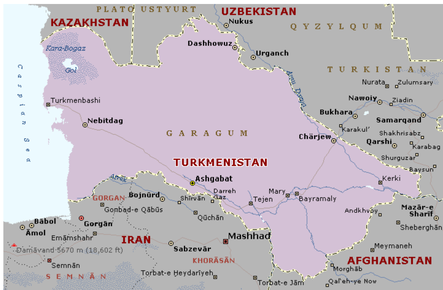
Рис.23 Карта Туркменистана

22 августа 1990 г. Туркменистан провозгласил свой суверенитет в составе СССР. В октябре 1990 Сапармурат Ниязов , первый секретарь компартии Туркменистана с 1985 г. и председатель Верховного совета республики, был избран президентом республики в ходе безальтернативных выборов. 26 октября 1991 г. правительство провело референдум по вопросу о независимости Туркменистана; за независимость проголосовало 94% населения. 27 октября 1991 г. Верховный совет объявил Туркменистан независимым государством, а в конце декабря 1991 г. страна присоединилась к СНГ. В 1992 г. была принята конституция Туркменистана.