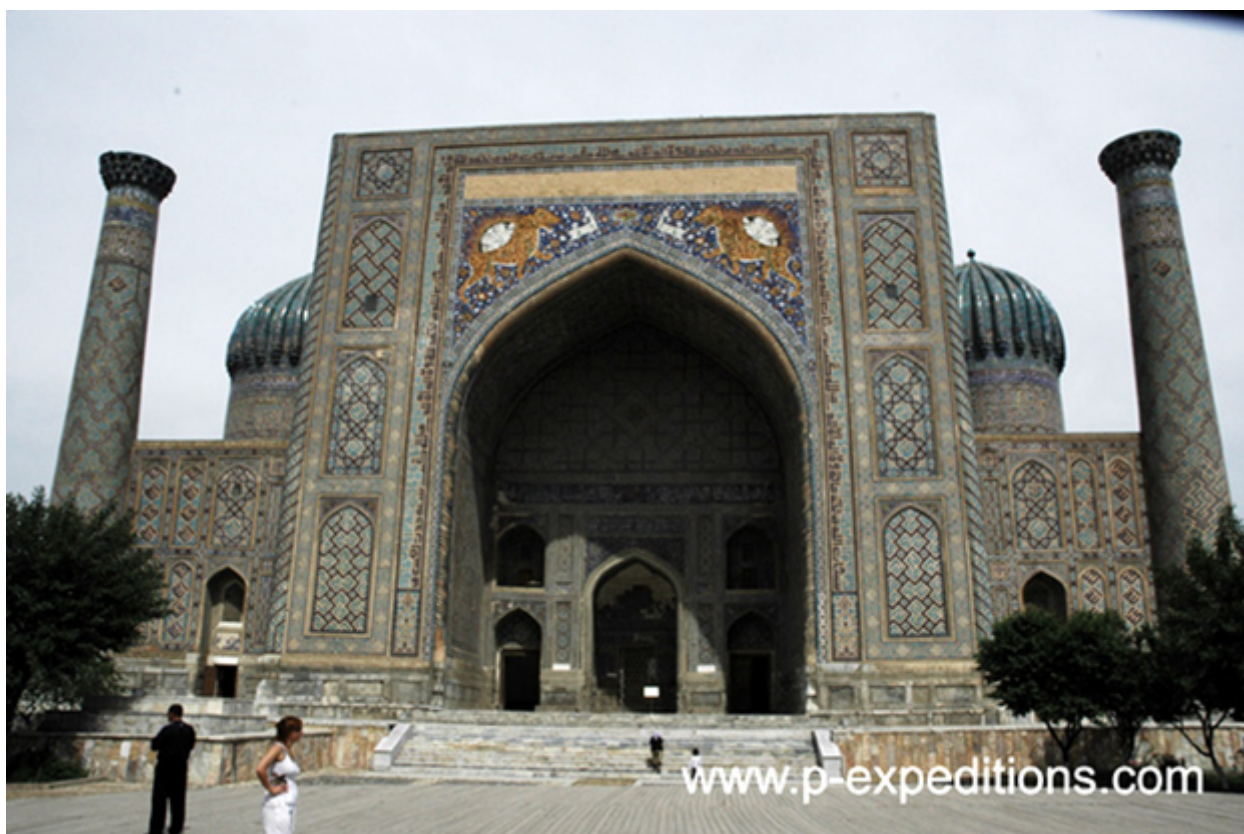
Рис.28 Архитектура столицы Туркменистана(2)

Отношения Туркменистана со странами СНГ базируются на концепции минимального развития многосторонних отношений при максимальном расширении двусторонних связей.