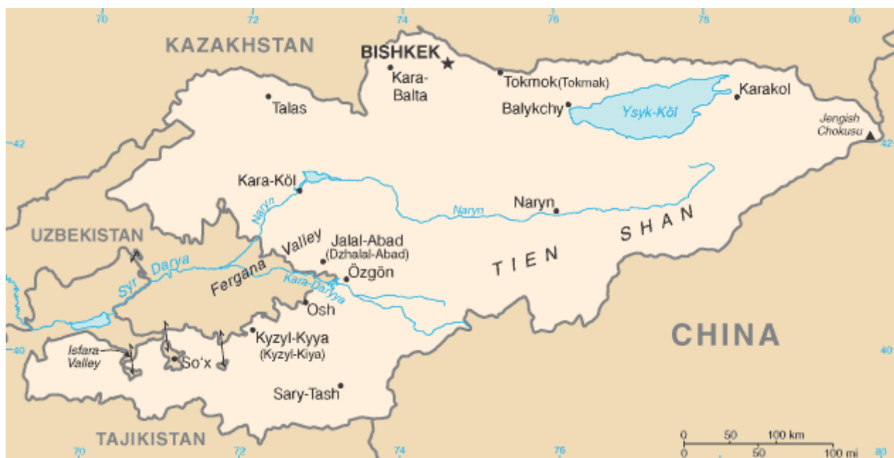
Рис.32 Карта Киргизии

Начатые сверху реформы породили независимую прессу, зарегистрировалось 12 политических партий и социальных движений. Выборы 1994 и 1995 гг. названы международными наблюдателями «честными и свободными». Но с конца 1994 г. президент становится все более зависимым от клановой поддержки. Эта поддержка позволила ему выиграть выборы 1995 и 2000 гг. Клановость подрывает парламентскую и судебную независимость, поскольку политическое соперничество основывается на клановой поддержке.