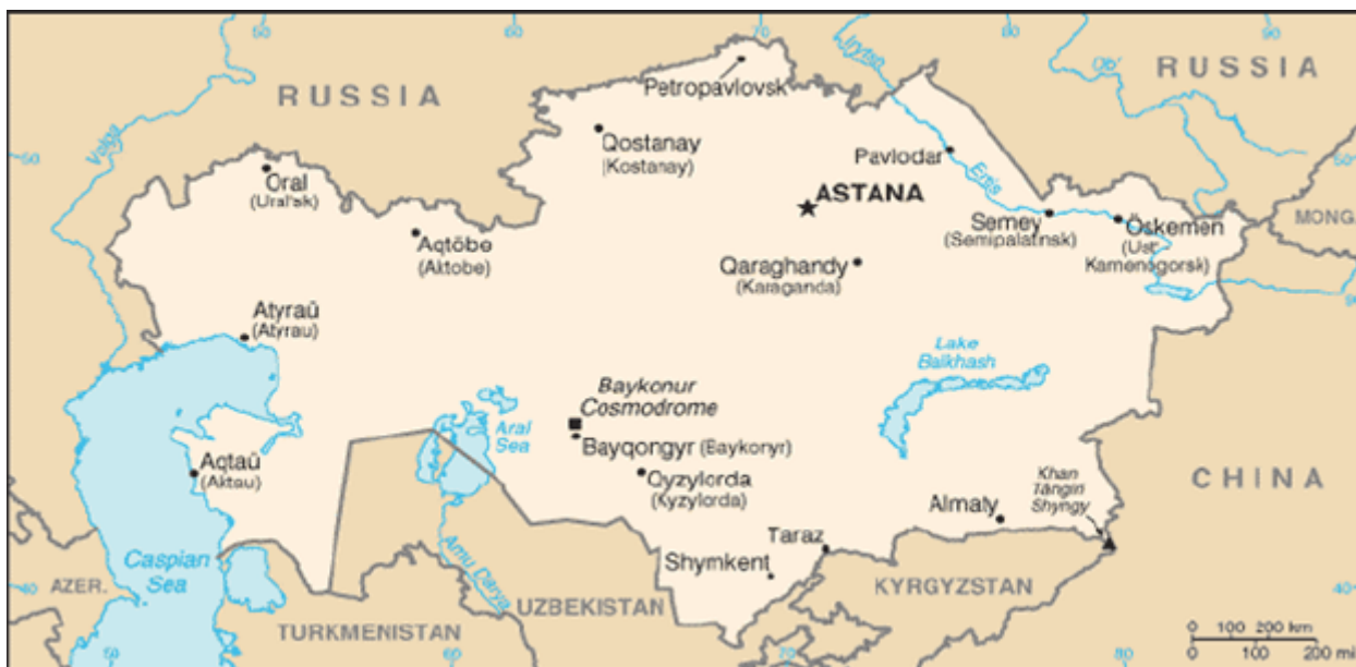
Рис.11 Карта Казахстана

25 октября 1990 г. Верховный совет Казахской ССР принимает Декларацию о государственном суверенитете, в которой впервые была закреплена неделимость и неприкосновенность территории. Страна была определена как субъект международного права, был введен институт гражданства, а также равноправие форм собственности.