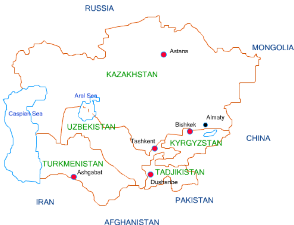
Рис.1 Карта Центральной Азии

Как политическое понятие, этот регион обладает более суженными границами и объединяет пять бывших советских республик, которые стали независимыми государствами. Это огромный по размерам и политически разнородный регион, отрезок так называемой «дуги нестабильности», которая огибает Российскую Федерацию с юга площадью 4 млн кв. км с населением свыше 50 млн человек.