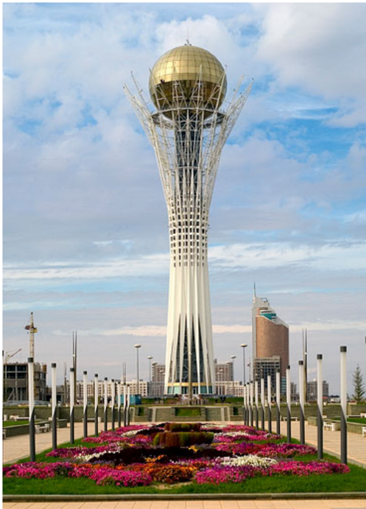
Рис.16 Байтерек - монумент независимости

Однако за годы реформ власть парламента оказалась ограниченной, СМИ остались под жестким контролем правительства, местные органы власти не стали реальной силой, а оппозиционные партии создавать все труднее. Растет экономическое влияние Назарбаева и его семьи. Семья Назарбаева стала господствующей экономической силой в стране. Независимость позволила немногочисленной элите преобразовать политическую власть в экономическое богатство.