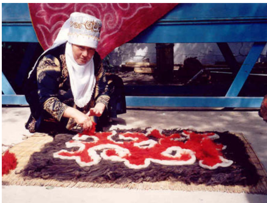
Рис.36 Киргизская женщина в национальной одежде

Передел собственности, начавшийся после «Революции тюльпанов», принимает масштабы, вызывающие серьёзные опасения и представляет реальную угрозу экономической и социальной стабильности в стране.