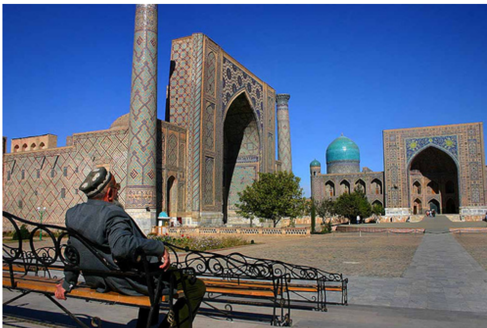
Рис.20 Архитектура Узбекистана(1)

населения, расширением границ бедности, становлением абсолютной бедности, подъемом явной и скрытой безработицы.