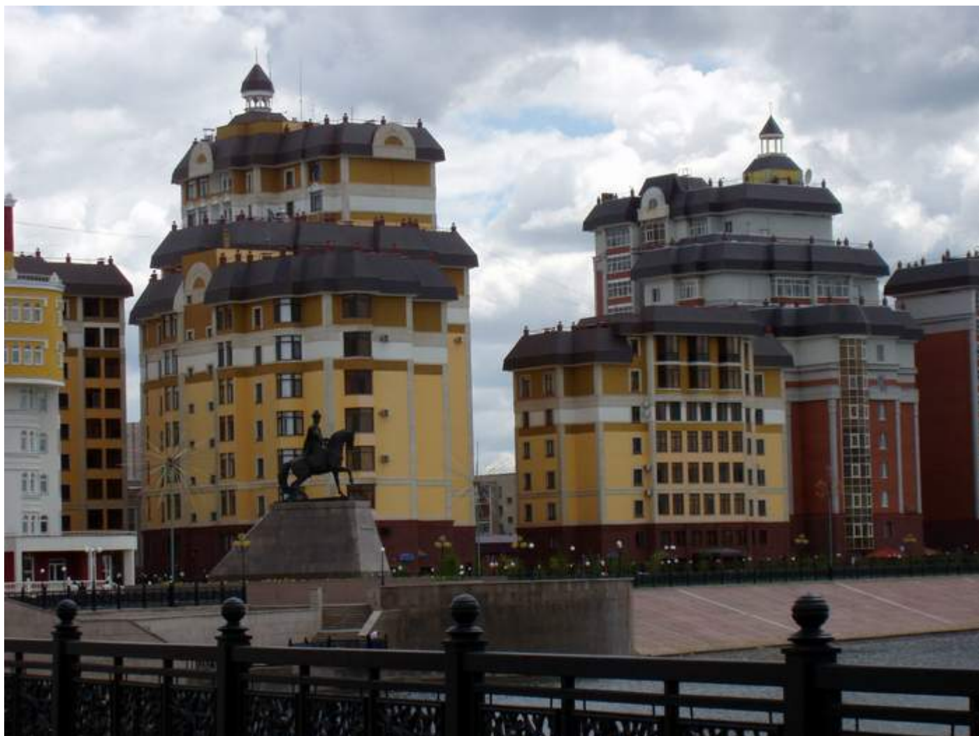
Рис.14 Набережная Астаны

В октябре 1998 г. парламент проголосовал за внесение изменений в Конституцию. Они предусматривали продление срока полномочий президента с 5 до 7 лет. На досрочных президентских выборах в январе 1999 г. Назарбаев победил, собрав 80% голосов. В октябре последовали парламентские выборы, принесшие победу сторонникам президента (партии «Отан», Гражданской, Аграрной, Кооперативной и др.).