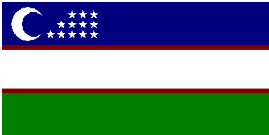
Рис.18 Флаг Узбекистана

Согласно закону о политических партиях (1996 г.) в Узбекистане разрешена деятельность только Национальной демократической партии (НДПУ), «Прогресса Отечества», социал-демократической партии «Справедливость» и «Национального возрождения». Все организации полностью поддерживают президента страны. В 1998 г. была зарегистрирована новая организация – «Самоотверженные», чья платформа мало отличалась от НДПУ.