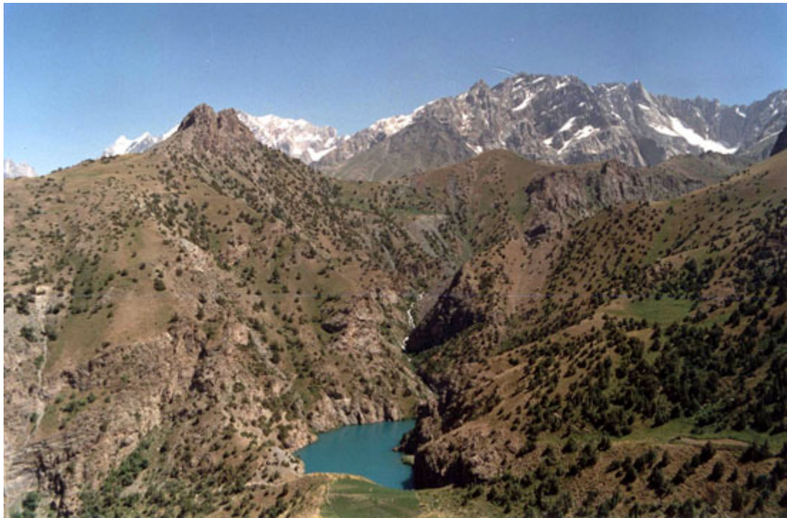
Рис.3 Горные вершины в Таджикистане

В Туркменистане находятся более половины акватории Туямуюнского гидроузла, обеспечивающего водой Республику Каракалпакию и Хорезм, головные водозаборы и другая инфраструктура Аму-Бухарского машинного и Каршинского магистральных каналов, от которых зависит водообеспеченность Бухарской и Навоийской и Кашкадарьинской областей Узбекистана.