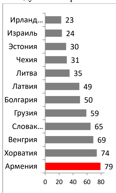
Рисунок 3. Индекс глобальной конкурентоспособности, 2016-2017 гг.

• Обладая средним – с общемировой точки зрения – уровнем развития общих инфраструктур, Армения в этой сфере уступает сопоставляемым странам; исключения составляют только инфраструктуры сфер телекоммуникаций и воздушных перевозок.