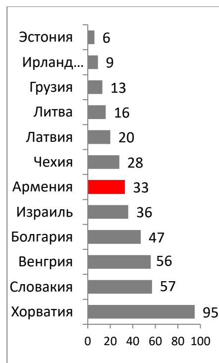
Рисунок 5. Индекс экономической свободы, 2017

Источник: Всемирный Банк, Doing Business, 2017. [Электронный ресурс]. – Режим доступа: URL: http://www.doingbusiness.org/~media/WBG/DoingBusiness/Documents/Annual-Reports/English/DB17-Report (дата обращения 16.02.2018).