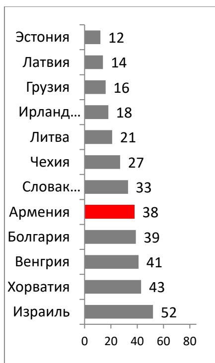
Рисунок 4. Индекс «Doing Business», 2017 г.