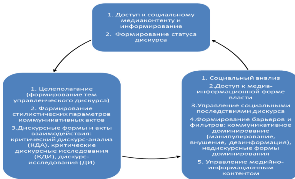
Рисунок 1. Информационно-целевая технология управления дискурсом

ния, в котором доминирование рассматривается как неравенство, несправедливость и неравноправие, т.е. исследуются все формы нелегитимных действий и ситуаций. В параграфе подчеркивается, что чем выше статус дискурса и чем он влиятельнее, тем менее он публичен и доступен для критического анализа – иногда это закреплено юридически, как в случае с «кабинетными» совещаниями. Выводы из предпринятого в параграфе анализа коммуникативного взаимодействия государства и общества обобщены в следующей модели управленческого дискурса (Рис.1):