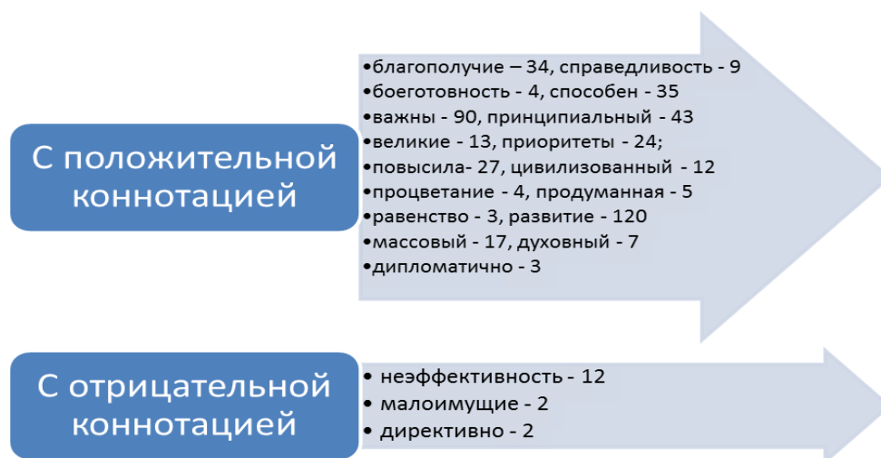
Рисунок 4. Оценочные слова в социальных блоках Посланий Президента РФ Федеральному Собранию РФ

шили», «нам необходимо», «мы достигли» не выражают идеи единства или коллегиальности.