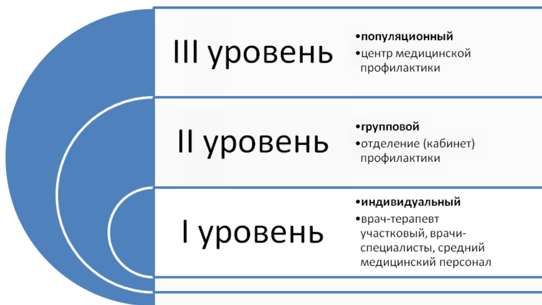
Рисунок 3 – Трехуровневая система оказания профилактической медицинской помощи офицерам запаса (в отставке)

Эффективность предлагаемого алгоритма сопровождения офицеров запаса (в отставке) с разработанными целями и задачами для каждого этапа доказана в процессе реализации комплекса мероприятий по совершенствованию медико-социальной и психологической помощи. При этом отмечено повышение большинства показателей качества жизни в динамике (за период 6 месяцев), особенно по шкале «Физического функционирования» (с 55,4 до 66,8 баллов), «Социального функционирования» (с 63,5 до 69,5 баллов) и «Психического здоровья» (с 60,8 до 66,4 баллов), стал выше уровень общей оценки здоровья (с 60,2 до 65,7 баллов).