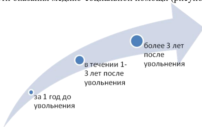
Рисунок 2 – Этапы медико-социального сопровождения военнослужащих запаса (в отставке).

Разработана трехэтапная система медико-социальной помощи военнослужащим запаса (в отставке) и алгоритм ее реализации, включающий регламент внутриведомственного взаимодействия. Предложенная модель призвана обеспечивать максимально возможно раннюю идентификацию социального неблагополучия и дальнейшую маршрутизацию в целях своевременности оказания медико-социальной помощи (рисунок 2).