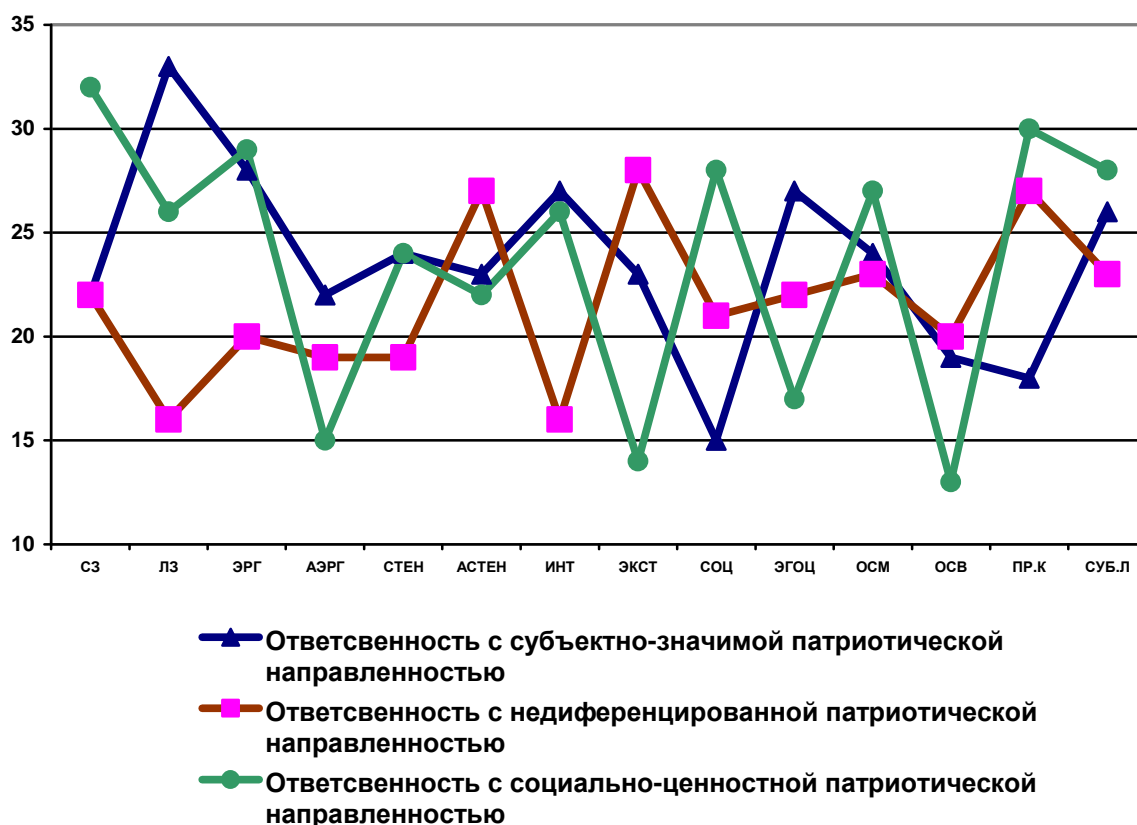
График 2. Профили ответственности с различной патриотической направленностью (N=147)

В качестве доминантных признаков в структурной организации свойства выступают лично значимые цели, эгоцентричность и субъектно-личностная продуктивность. При соотношении этих признаков у испытуемых активизируется самоконтроль поведения и деятельности, повышается психоэмоциональный тонус, активизируются когнитивные функции, направленные на результативность проявления ответственности. Весь этот механизм обеспечивает удовлетворение эгоцентрических потребностей, связанных с самовыражением. При доминировании социальных побуждений к проявлению ответственности происходит снижение функциональной нагрузки на ведущие составляющие ответственности, что в свою очередь приводит к упрощенной схематизации проявления ответственности.