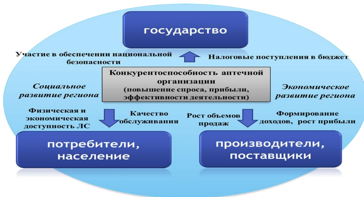
Рисунок 7 – Неформализованная модель значимости КСП АО как стартового условия достижения целей различных субъектов экономики

аптеки, предприятий-партнеров (производители, поставщики), населения (покупателей/потребителей медицинских и фармацевтических товаров), государства, региона (рисунок 7).