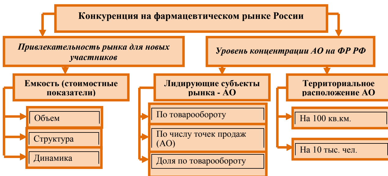
Рисунок 3 – Дизайн оценки конкуренции на ФР России

Наблюдавшееся в последние годы незначительное снижение темпов прироста объема рынка обусловлено, с одной стороны, кризисными явлениями в экономике, с другой, - активной деятельностью государства на ФР и принятием ряда законодательных актов, которые частично ограничили свободу экономических действий АО. В таблице 1 представлены результаты статистического анализа и математического моделирования, подтверждающие усиление конкуренции на ФР.