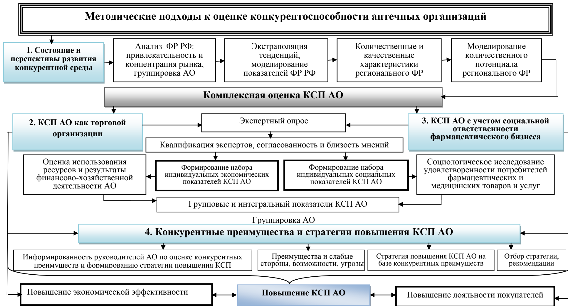
Рисунок 1 – Концептуальная схема формирования методического подхода к оценке КСП АО