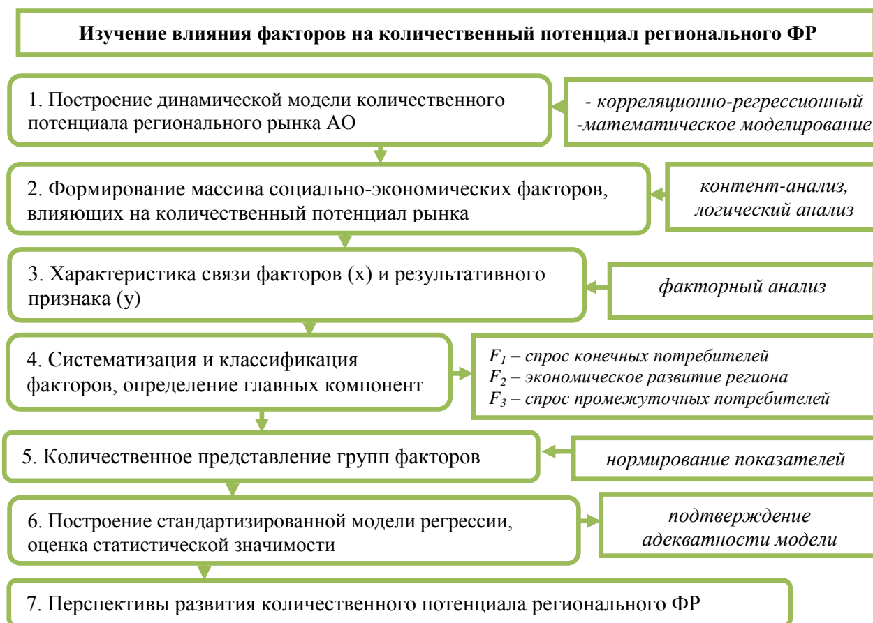
Рисунок 4 – Алгоритм оценки влияния факторов на количественный потенциал регионального ФР

В алгоритме выделены семь этапов, последовательное выполнение которых позволяет выявить основные группы факторов и степень их влияния на количественный потенциал рынка. На основании статистических данных по Курской области сформирован массив показателей. В перечень наиболее значимых факторов отобраны те, парный коэффициент корреляции которых превышает 0,5 и подтверждает тесную стохастическую связь с результативным признаком. Всего отобрано 15 показателей. Логическим путем вышеуказанные факторы систематизированы в 3 главные компоненты, в частности, F_1 – показатели, влияющие на спрос конечных потребителей, т.е. населения (данные переменные имеют наиболее тесную связь с результативным признаком).