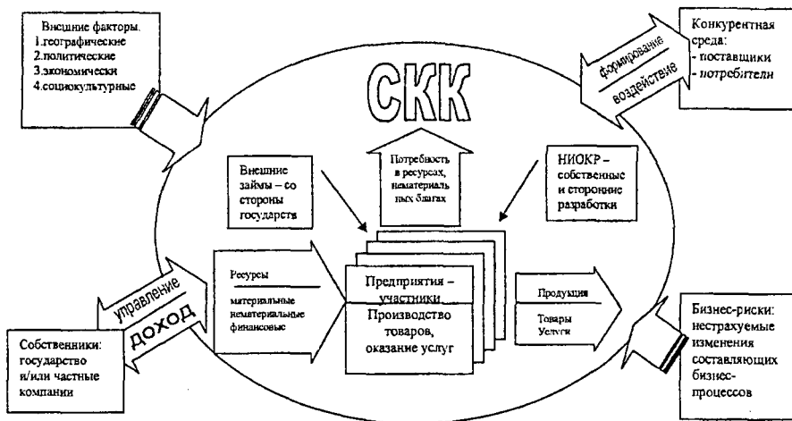
Рисунок 1. Организация информационных сигналов