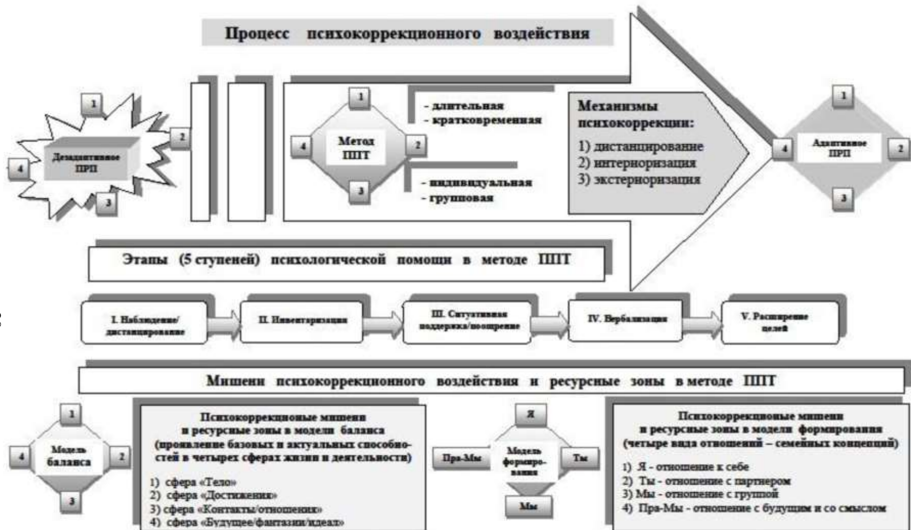
Рисунок 2. – Модель психокоррекции дезадаптивного полоролевого поведения методом позитивной психодинамической психотерапии