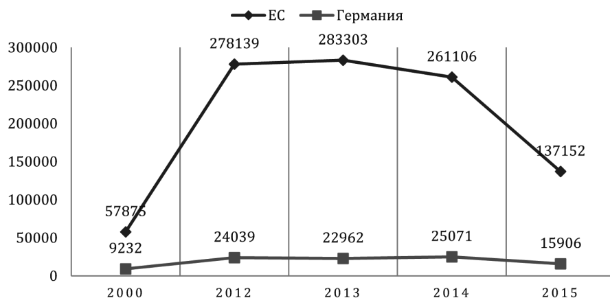
Рис. 1. Российский экспорт в ЕС и ФРГ (млн долл.), 2000—2015 гг.

ранее). Таким образом, доля России в общем немецком экспорте уменьшилась до уровня менее 2%. Наблюдается также сокращение в объеме экспортируемой из России продукции. По итогам 2015 г. было отмечено падение товарного экспорта из России как в ФРГ, так и в ЕС в целом: на 48% в ЕС (137,2 млрд долл. в 2015 г. по сравнению с 261,12 млрд долл. в 2014 г.) и на 37% в ФРГ (15,9 млрд долл. в 2015 г. по сравнению с 25,1 млрд долл. в 2014 г.) (рис. 1). Положительное для России сальдо торгового баланса составило 6,3 млрд евро против 8,0 млрд евро. По итогам 2015 г. РФ с 11-го места в рейтинге ведущих торговых партнеров Германии переместилась на 13-е. В абсолютном выражении — 20 млрд евро против 29,3 млрд евро по итогам 2014 г. [2].