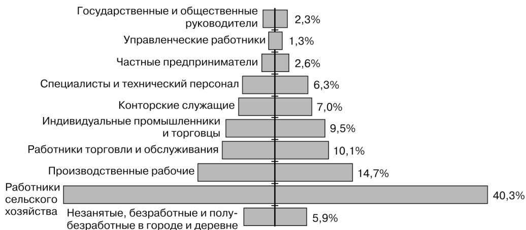
Рис. 1. Десять страт современного китайского общества

В первую страту входят партийные и правительственные руководители, главы учреждений, социальных организаций, занимающиеся административным управлением (руководители (центральных правительственных) министерств и комиссий, городов центрального подчинения, провинциальные, городские, региональные и вышестоящие чиновники). Китайская социальная политика определяет этот слой как высочайший в стратификационной структуре, как авангард и организатор развития социальной и рыночной экономики [10. С. 25].