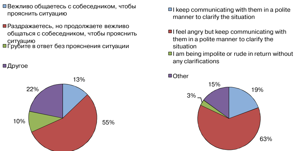
Рис. 2. Как Вы обычно реагируете на проявление невежливости и грубости по отношению к Вам? / How do you usually react when people are being impolite or rude to you?

Мы также пытались выяснить, как люди склонны реагировать на невежливость и грубость (рис. 2). В ответах на вопрос закрытого типа «Как Вы обычно реагируете на проявление невежливости и грубости по отношению к Вам?» / “How do you usually react when people are being impolite or rude to you?” русские и американские информанты показали, что стараются прояснить причины возникшей по отношению к ним невежливости/грубости, испытывая при этом чувство раздражения (55% и 63% соответственно), либо отвечают вежливостью на невежливость (13% и 19% соответственно); 10% русских прибегают к ответной грубости, и только 3% американцев поступают так же.