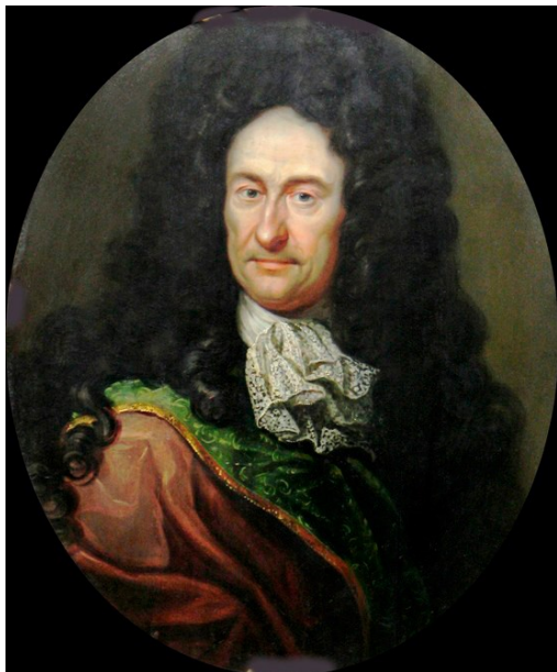
Готфрид Вильгельм Лейбниц

дискуссиях фактически были заложены основы реляционной концепции (парадигмы) в естествознании, для принятия которой в физике тогда еще не созрели необходимые условия.