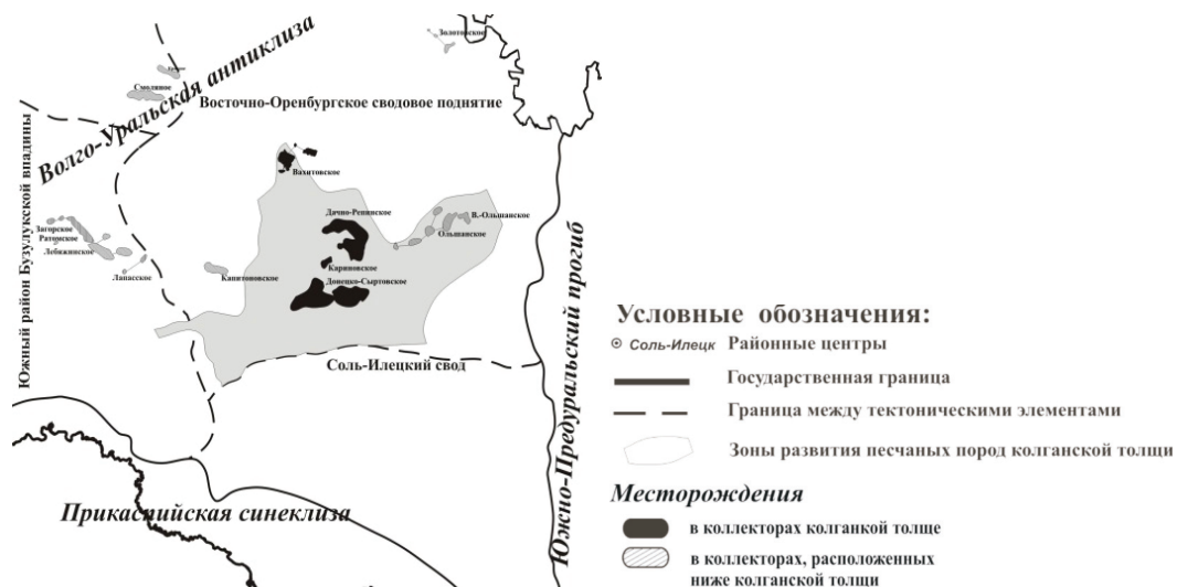
Рис. 1. Структурно-тектоническая схема (по материалам Г.Д. Яхимовича)

Область развития колганской толщи оконтурена в пределах Колганско-Борисовского палеопроггиба, образовавшегося в позднефранскую эпоху вследствие опускания Южной части Восточно-Оренбургского палеоподнятия. Значительную роль в формировании седиментационных и денудационных структур сыграли зоны инверсионных поднятий франско-фаменского возраста, развитых вдоль северного обрамления Прикаспийской впадины. К таким структурам относятся Илекско-Икское, Чинаревско-Кошинское, Каринское и другие палеоподнятия.