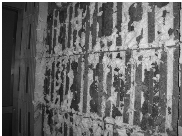
Рис. 3. Фрагмент стены со снятым слоем пенополистирольной опалубки

кального положения стены без аномальных неровностей. На рисунке 3 представлен фрагмент стены со снятым слоем пенополистирольной опалубки.