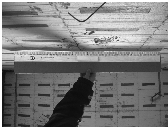
Рис. 1. Выявленное отклонение поверхности потолка от проектного положения

Технологические дефекты монолитных железобетонных конструкций, возведенных в несъемной пенополистирольной опалубке, выявляют в процессе визуального обследования (рис. 1).