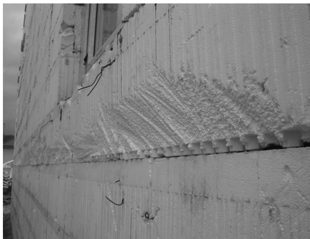
Рис. 4. Фрагмент наружной стены с дефектом, «зачищенным» заподлицо

На рисунке 4 представлен фрагмент наружной стены, подготовленной к началу отделочных работ.