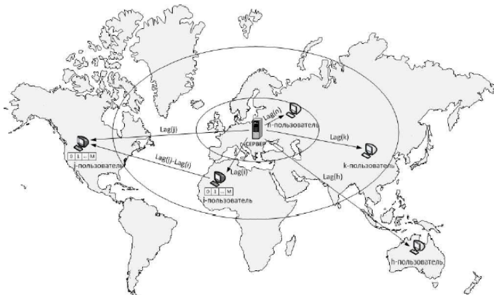
Рис. 1. Задержки передачи информации от сервера-источника

данных начинается спустя T_s тактов с начала моделирования ( T_s < T ). Каждый пользователь имеет буфер для хранения видеоданных размера M+1 , где M мест предназначено для хранения и обмена порциями данных с другими пользователями, а 0-место – для загрузки наиболее «свежей» порции от сервера. Таким образом, вектор состояния буфера n -пользователя имеет вид x(n)=(x_0(n), x_1(n), \dots, x_M(n)) , где x_m(n)=1 , если m -место буфера занято порцией данных и x_m(n)=0 в противном случае, m=0, \dots, M . Порция видеоданных на M -месте буфера, наиболее «старая» порция видеоданных у пользователя, находится ближе всего к воспроизведению.