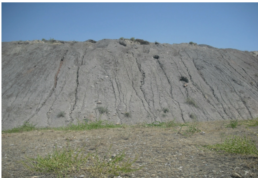
Рис. 2. Хребтовидный отвал

2. Хребтовидные отвалы высотой до 20—30 м, объемом более 200 000 т складываются так же, как терриконы (рис. 2).