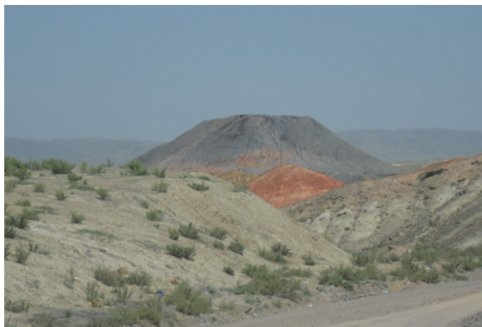
Рис. 1. Террикон

1. Терриконы — конические отвалы высотой 60—70 м и объемом более 250 000 м 3 (рис. 1). Они отсыпались на территории действующих шахт вплоть до 1988 г. Складирование отвалов зависит от рельефа местности, в связи с этим большинство углеотходов Кызылкийского бурогоугольного месторождения складировались на ближайших хребтах. Поэтому они в большинстве случаев имеют вид хребтовидных отвалов.