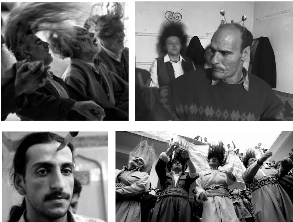
Рис. 6. Прически суфиев Исавийи и Кадирийи

Однако, несмотря на очевидное противоречие с исламскими этическими и эстетическими нормами, даже под такой феномен было подведено философское обоснование. А именно: хаммар , совершая ритуальное самоистязание, в действительности борется со своим нафсом , который коренится в любви и жалости по отношению к своей плоти. Таким образом, вырвав из сердца страх перед болью и смертью, человек духовно освобождается и преображается. Характерно, что в суфийских радениях Исавийи участвуют люди самого разного социального происхождения, интеллектуального уровня, мировоззренческих позиций и политических взглядов. Есть только гендерное ограничение. Женщины могут выполнять все функции, кроме хаммара .