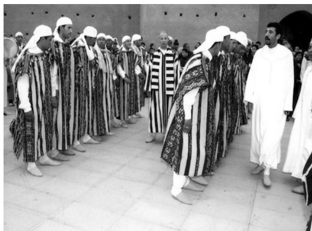
Рис. 3. Церемония встречи шейха (хандира) [8]