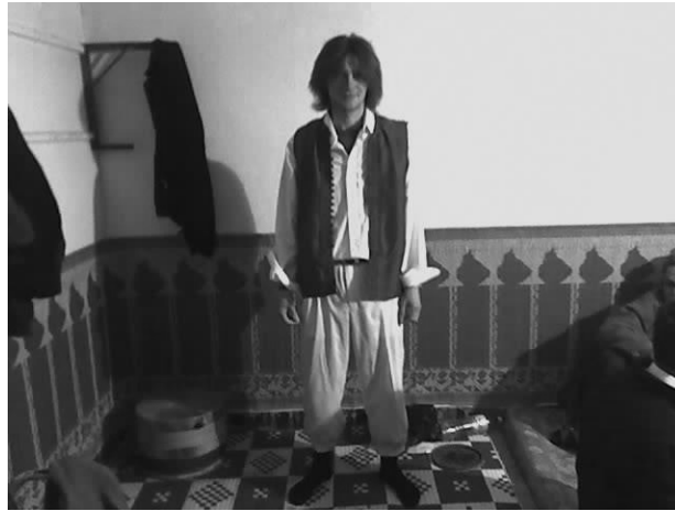
Рис. 4. Тунисский костюм Исавийи