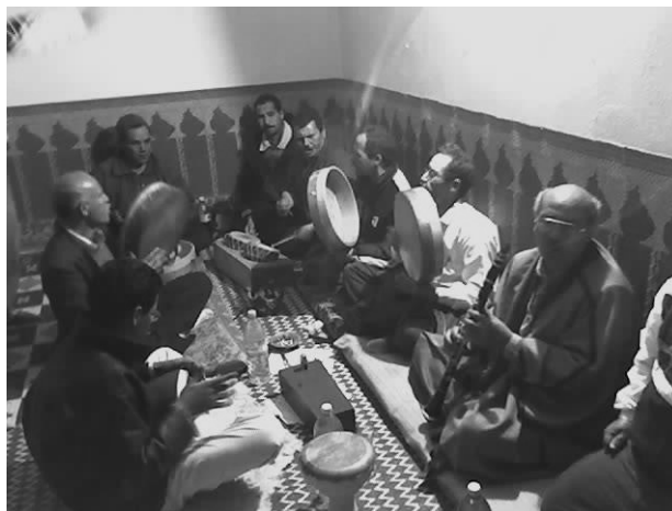
Рис. 5. Репетиция ляджны

Кульминация наступает, когда первый из дервишей достигает экстатического состояния, направляемый взвинченным ритмом и голосами музыкантов. Тогда он выдвигается вперед из общего ряда танцоров и дает знак, что готов выполнить роль хаммара , т.е. готов к самоистязанию.