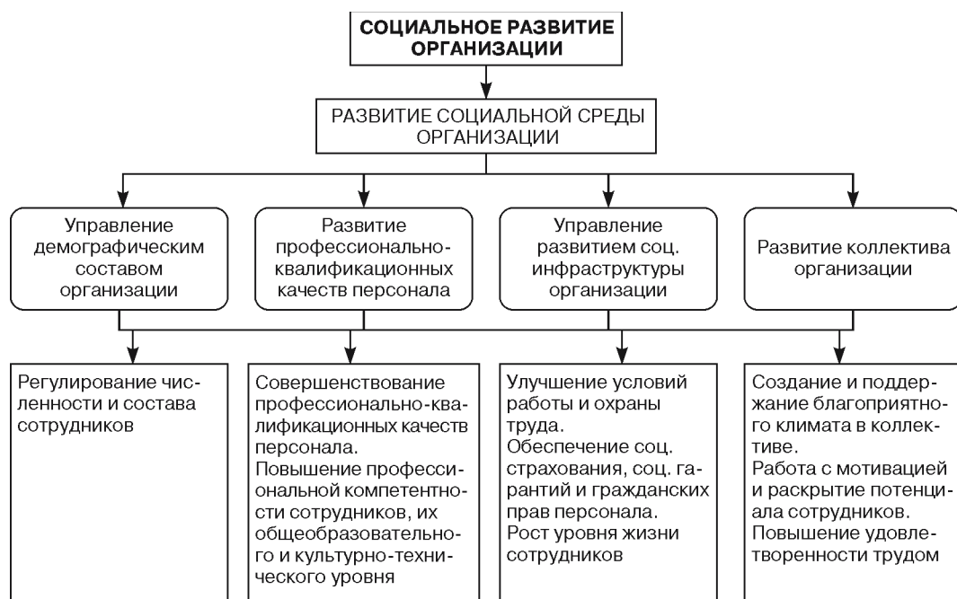
Рис. 1. Структура управления социальным развитием организации

По нашему мнению, социальное развитие организации должно быть направлено на улучшение социальной среды. Эту среду образует сам персонал с его различиями по демографическим и профессионально-квалификационным качествам, социальная инфраструктура и все то, что так или иначе определяет качество трудовой жизни работников [6] (рис. 1). Поэтому под социальным развитием мы понимаем процесс, направленный на улучшение социально-бытовых условий труда, профессиональных и личностных качеств сотрудников, а также на развитие коллектива организации. Управление социальным развитием представляет собой совокупность способов, приемов и процедур, позволяющих решать социальные проблемы на основе научного подхода, знания закономерностей протекающих социальных процессов, точного аналитического расчета и выверенных социальных нормативов [5].