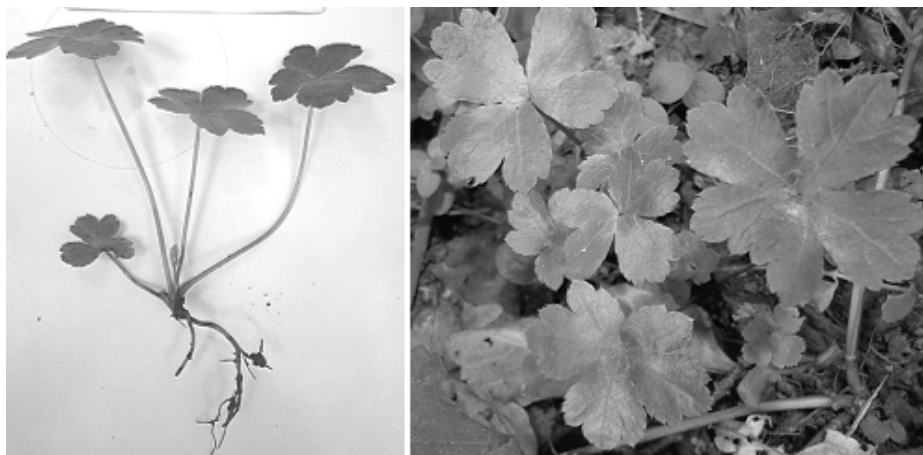
Рис. 3. Имматурные особи подлесника европейского