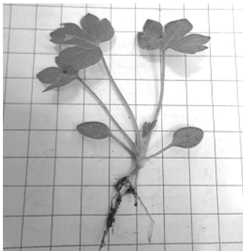
Рис. 2. Ювенильное растение подлесника европейского