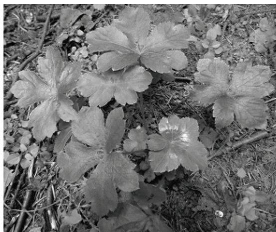
Рис. 4. Виргинильная особь подлесника европейского