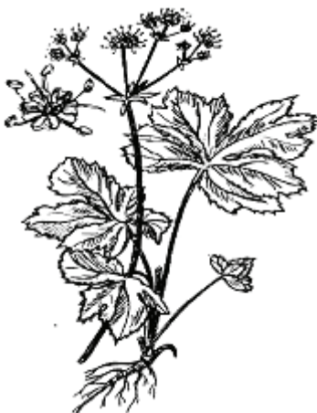
Рис. 5. Молодая генеративная особь подлесника европейского

В последующие годы особи подлесника переходят к цветению и плодоношению и становятся генеративными. Среди генеративных особей этого вида можно выделить три группы: молодые генеративные растения (рис. 5), средние генеративные и старые генеративные растения (табл. 3).