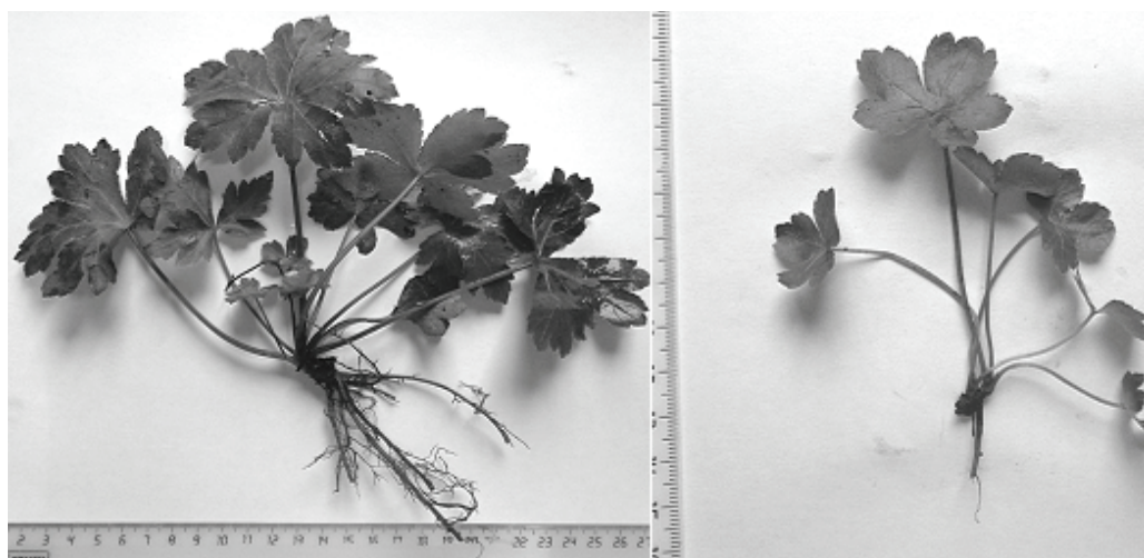
А Б Рис. 6. А — субсенильная особь; Б — сенильная особь подлесника

Их отличие от виргинильных и имматурных особей заключается в наличии многолетнего вертикального корневища и более глубоко надрезанных, почти расчлененных листьев по сравнению с молодыми особями.