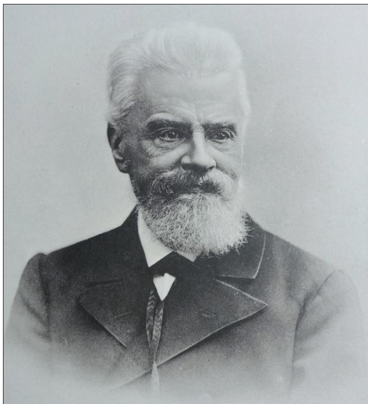
Рис. 1. Василий Николаевич Хитрово. Фото. Конец XIX в. Figure 1. Vasily Nikolaevich Khitrovo. Photo. The late XIX century

матери, его определили в частный «приготовительный» пансион Ф.В. Гроздова 3 . С 1848 по 1854 гг. обучался в Императорском Александровском лицее 4 , по окончании которого был определен в Государственный контроль, а затем в Морское министерство 5 . С апреля 1863 г. ведет отсчет период его 20-летней службы в Министерстве финансов, в котором он занимался организацией первых ссудно-сберегательных товариществ 6 . Его труды были отмечены в 1879 г. Большой золотой медалью Императорского Московского общества сельского хозяйства, а также избранием в члены Императорского Русского Географического (1869) и Русского Археологического (1880) обществ 7 .